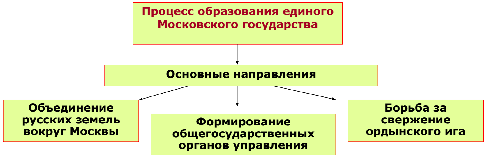
Схема 5.2. Направления и этапы процесса образования единого государства в XIV-XVI вв.