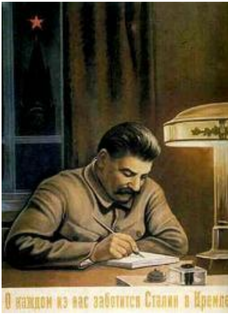
Плакат 1932 г.

Характерной чертой политической жизни этого периода стал культ личности И. Сталина. 21 декабря 1929 г., в день 50-летия Сталина, страна узнала, что у нее есть великий вождь. Он был объявлен «первым учеником Ленина». Вскоре Сталину стали приписывать все успехи страны. Он именовался «великим», «мудрым», «вождем мирового пролетариата», «великим стратегом пятилетки».