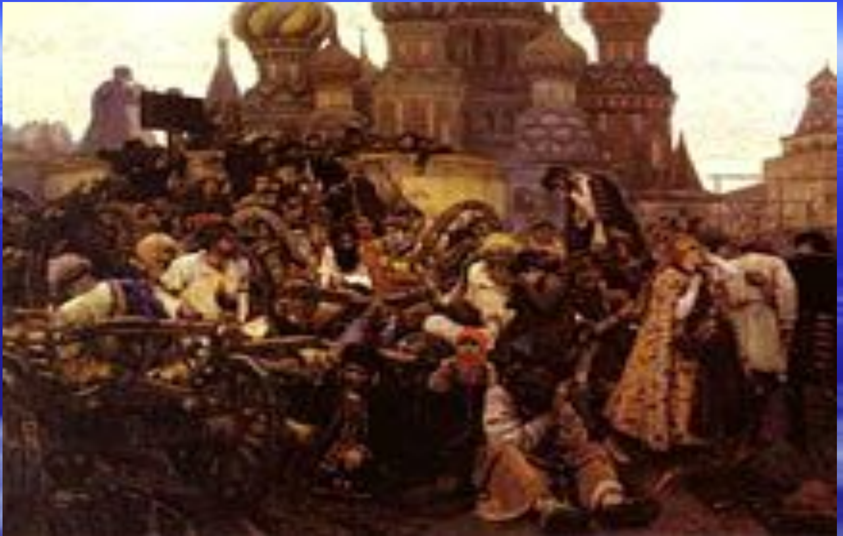
«Утро стрелецкой казни» художник В. Суриков