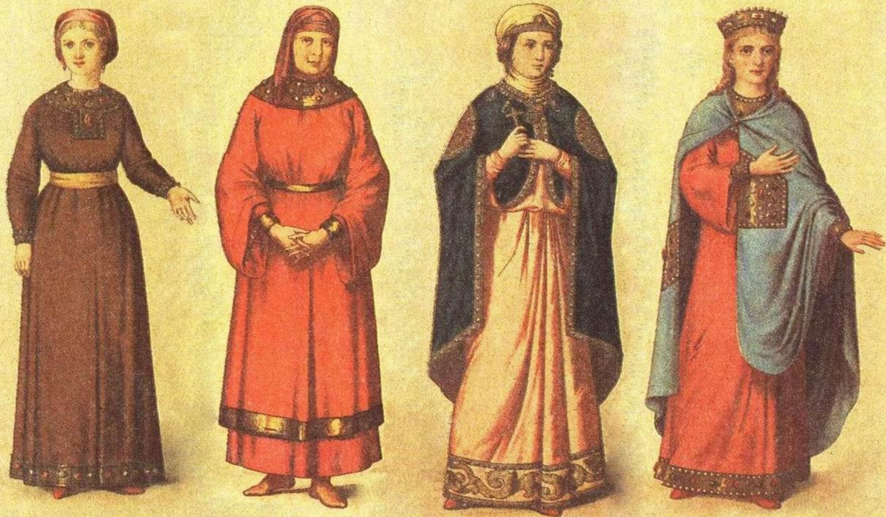
ОДЕЖДА ЗНАТНЫХ ЖЕНЩИН