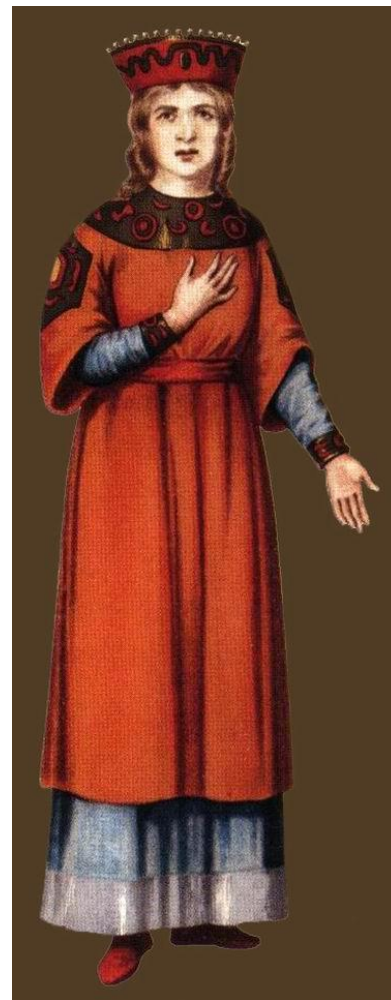
ОДЕЖДА РУССКОЙ ЗНАТИ