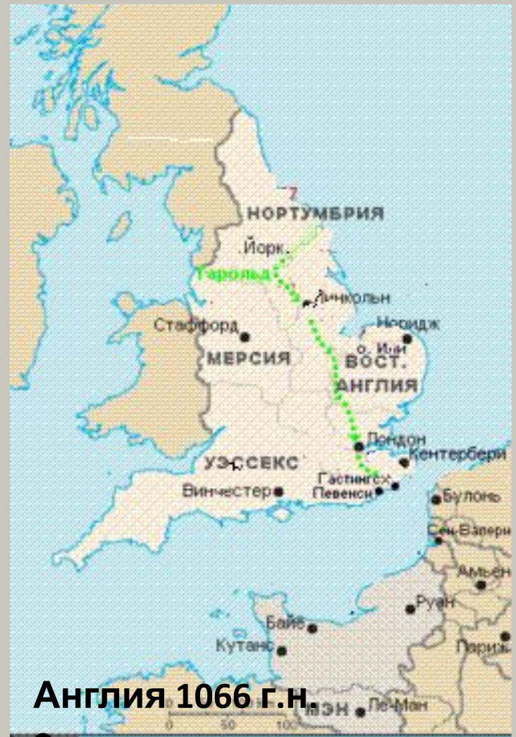
Англия 1066 г.н.