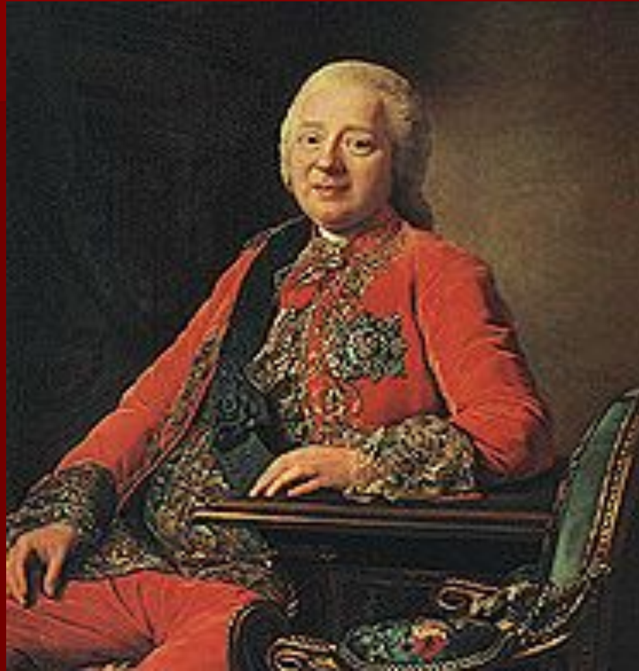
Н.И. Панин, сторонник Просвещения.