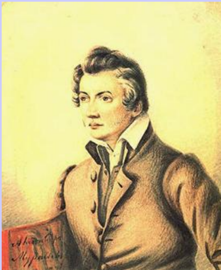
А.Муравьев. Портрет Н.Муравьева.