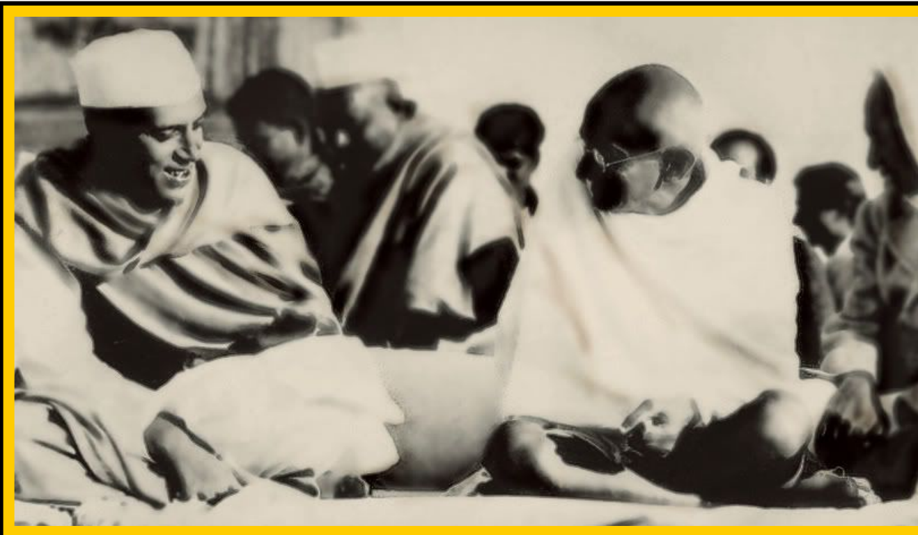
Ганди и Неру. 1937 г.

В 1931 г. стороны подписали соглашение, разрешавшее индийцам даже агитировать за независимость, но англичане его не всегда выполняли.