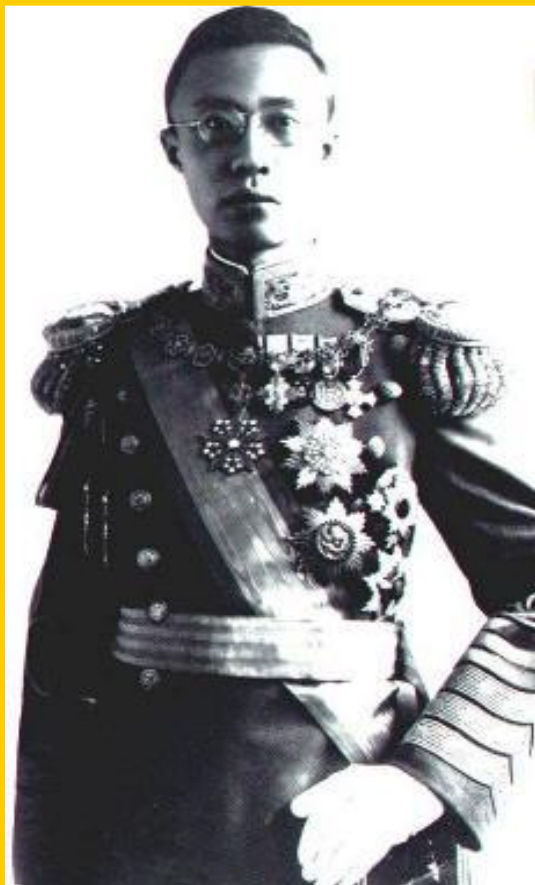
Пу И. Император Китая

В 1911-13 г. в результате Синхайской революции в Китае была свергнута династия Цин. В 1912 г. президентом стал Сунь Ятсен. Он хотел миновать стадию капитализма, опираясь на просвещенных людей. Для этого была создана партия Гоминьдан.