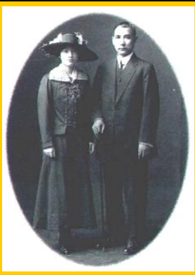
Сунь Ятсен с супругой