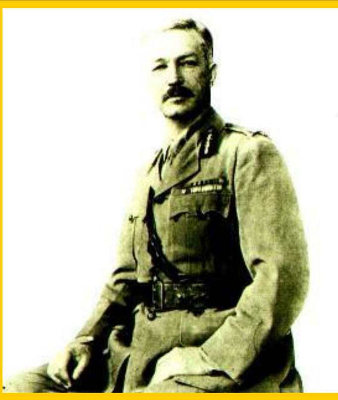
Реджинальд Даер – виновник Амритсарской бойни

В ответ индусы начали забастовки, сжигали английские товары. В 1921 г. Ганди вступил в Индийский Национальный Конгресс.