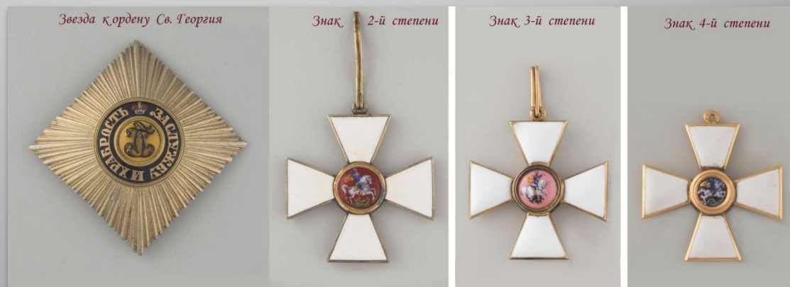
Звезда ордену Св. Георгия