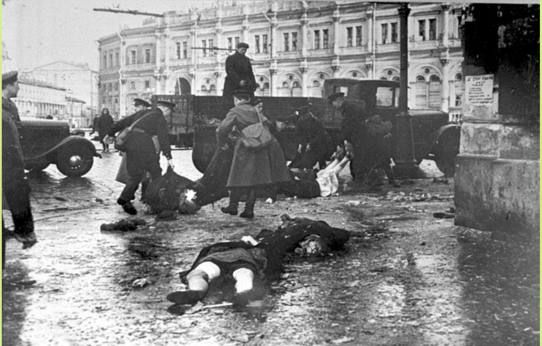
Октябрь 1941 г. Место съемки: г. Ленинград