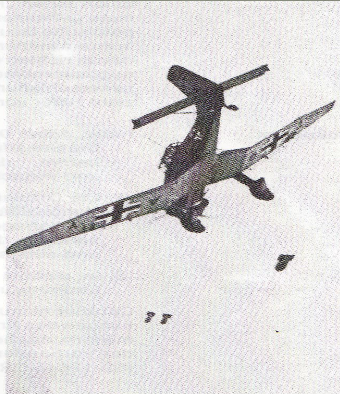
Angriff auf Polen