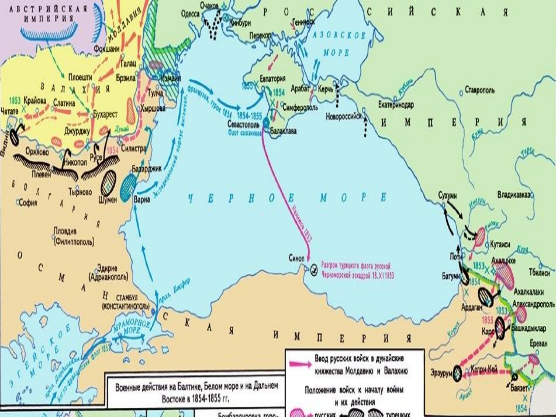
Военные действия на Балтике, Белом море и на Дальнем Востоке в 1854-1855 гг.

Ввод русских войск в дунайские княжества Молдавию и Валахию