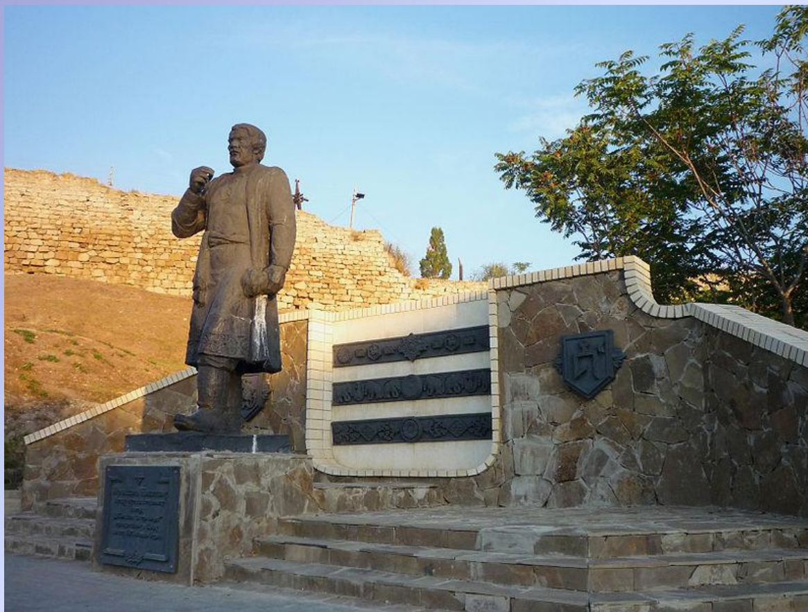
Памятник Афанасию Никитину в Феодосии.

Из Кафы с русскими купцами он отправился на родину.