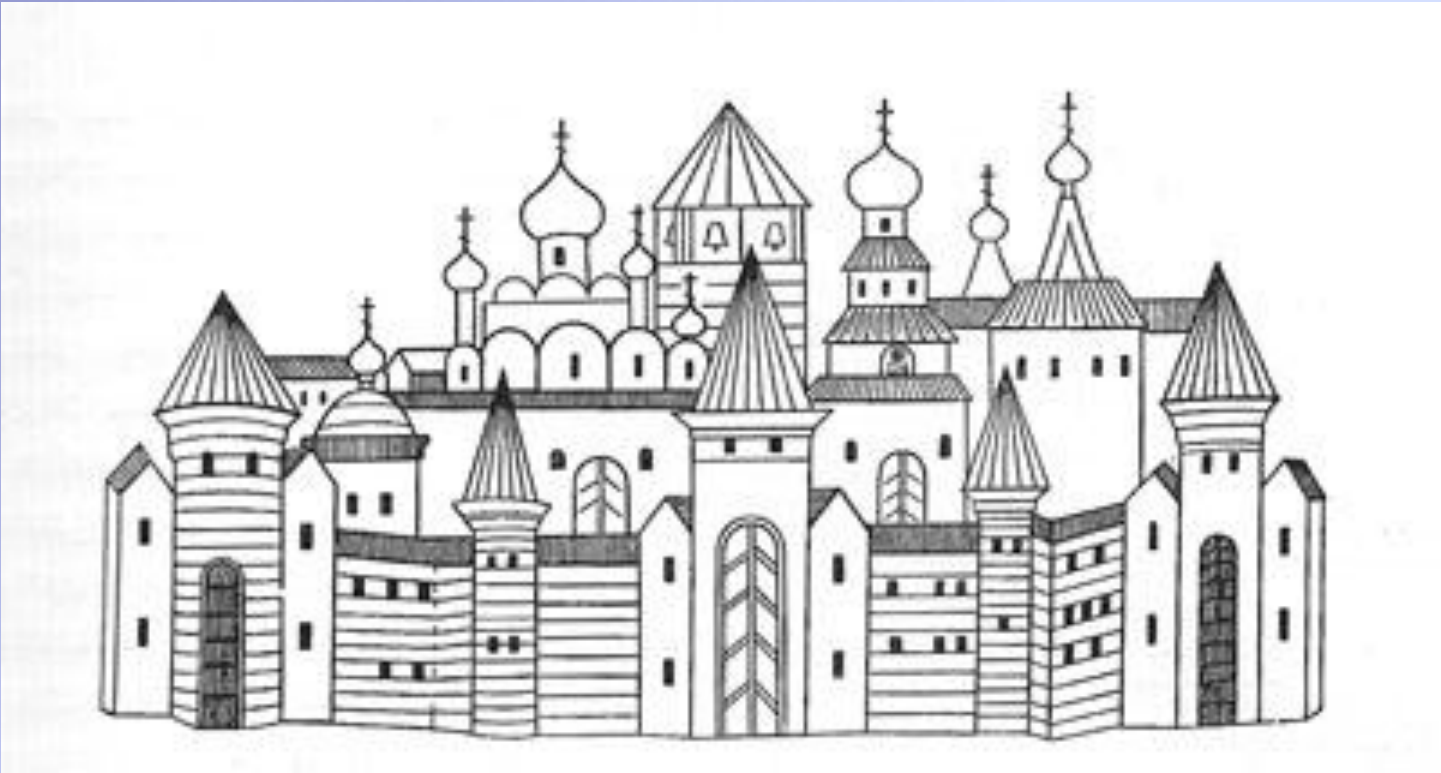
Тверской кремль в 15 веке.

«Поидох от Спаса святого златоверхого и с его милостию, от государя своего от великого князя Михаила Борисовича Тверского, и от владыки Генадия Тверского».