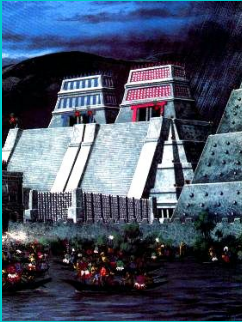
Ацтеки-воины у стен Мехико.

Численность армии достигала 150 тыс. Простолюдины за подвиги могли стать знатью.