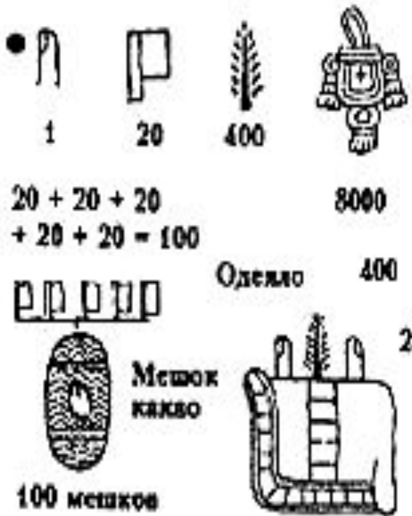
Счет у ацтеков.

Численность армии достигала 150 тыс. Простолыдины за подвиги могли стать знатью.