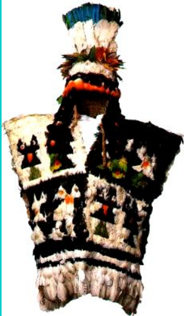
Торжественный наряд Великого Инки.

В Андах, на западе Ю. Аме - рики находилось государс - тво инков, возглавляемое Великим Инкой.