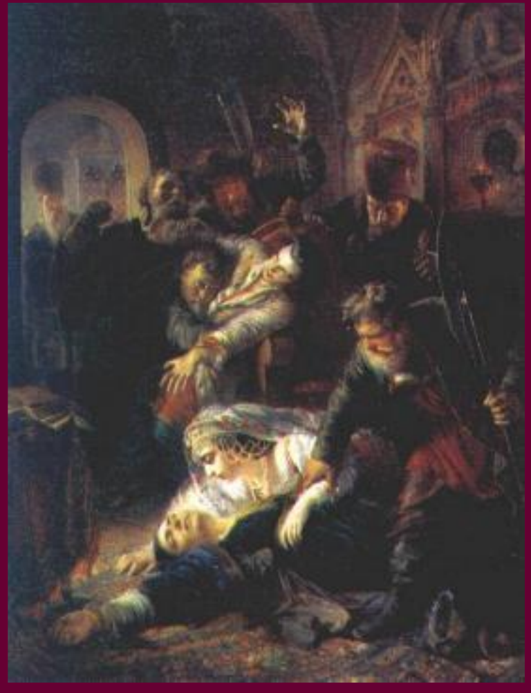
К.Маковский.Агенты Дмитрия Самозванца убивают сына Бориса Годунова..

В апреле 1605 г. Годунов скончался, оставив престол сыну Федору.