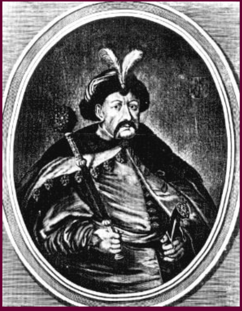
Гетман Украины Богдан Хмельницкий. Гравюра 17 в.

В сер.17 в. обострились от ношения между Польшей и Украиной. Центром сопротивления стала Запорожская Сечь. В 1648 г. казаки избрали Гетманом Б. Хмельницкого. Но Польский король отказался утвердить его.