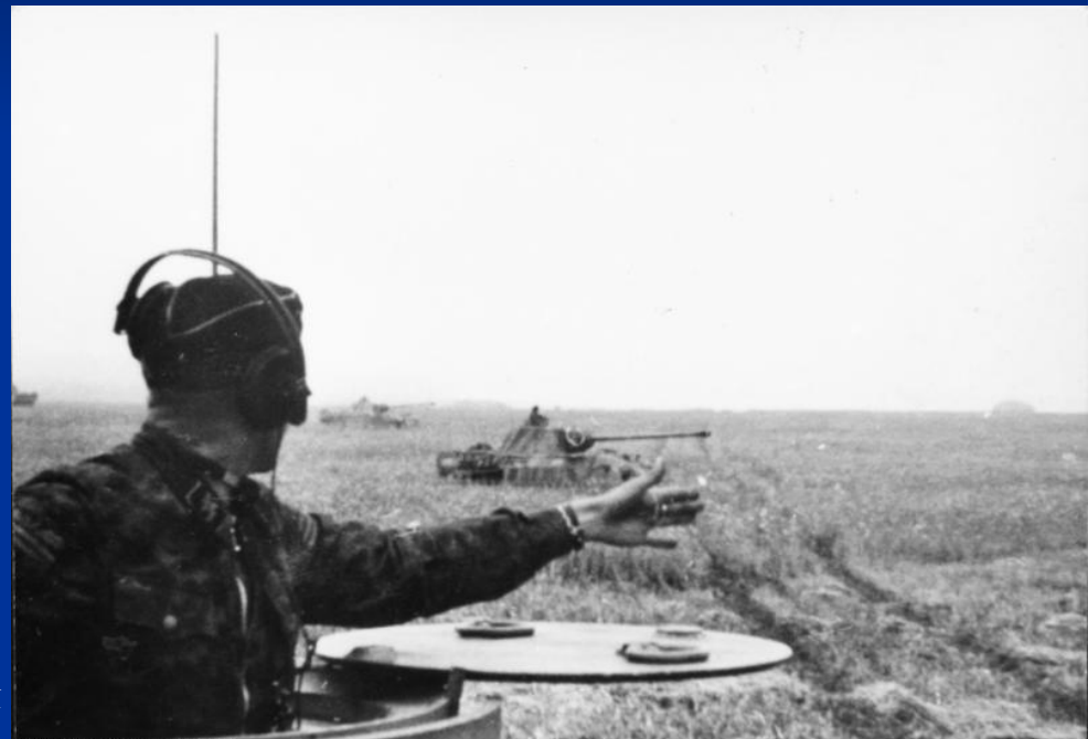
Bundesarchiv, Bild 10111-Merz-023-22 Foto: Merz | 1943 Juli - August

■ Важным фактором успеха немецких танковых частей явился произошедший к лету 1943 г. качественный скачок в боевых характеристиках немецкой бронетехники. Уже в ходе первого дня оборонительной операции на Курской дуге проявилась недостаточная мощность противотанковых средств, находящихся на вооружении советских частей, при борьбе как с новыми немецкими танками Pz. V и Pz. VI, так и с модернизированными танками более старых марок (около половины советских иптап были вооружены 45-мм орудиями, мощность 76-мм советских полевых и американских танковых орудий позволяла эффективно уничтожать современные или модернизированные танки противника на дистанциях вдвое-втрое меньших эффективной дальности огня последних, тяжёлые танковые и самоходные части на тот момент практически отсутствовали не только в общевойсковой 6 гв. А, но и в занимавшей позади неё второй рубеж обороны 1 танковой армии М. Е. Катукова).