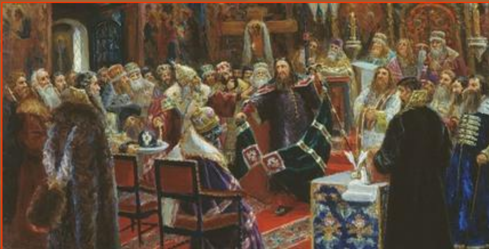
Суд над патриархом Никоном (С. Д. Милорадович, 1885 год)

Собор 1666 года одобрил реформы Никона, но он сам был отправлен в ссылку в Белозёрский Ферапонтов монастырь простым монахом