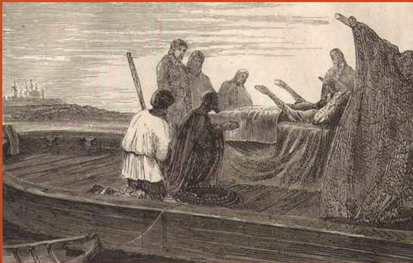
Смерть патриарха Никона (гравюра, 1870-е годы)

В 1681 году Никону разрешили переехать в Вознесенский Новоиерусалимский монастырь. Однако престарелый Никон умер в дороге близ Ярославля 17 августа 1681года.