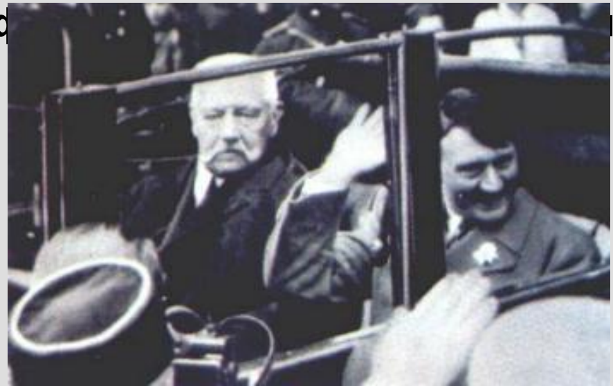
Президент Гинденбург и рейхсканцлер Гитлер