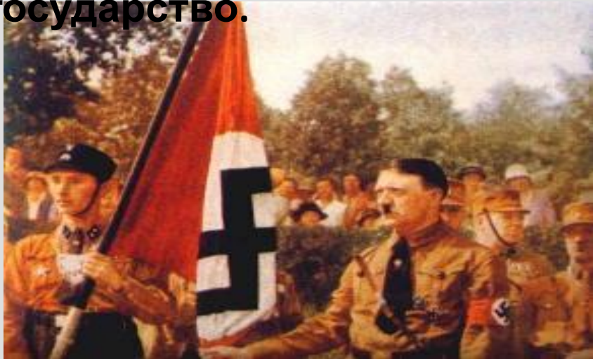
Гитлер и штурмовики

Экономический кризис 1929-1932гг. особенно сильно ударил по Германии: была парализована внешняя торговля, страна лишилась кредитов, спад производства составил 40%, в кризисе находилась банковская система, к 1932г. число безработных составило 8 млн. человек. В этих условиях резко возросло влияние фашистской партии НСДАП, а также коммунистов и социал-демократов. Однако последние недооценили опасность фашизма и не смогли договориться о совместных действиях, это обеспечило приход к власти Адольфа Гитлера. В 1933г. Гитлер был назначен рейхсканцлером (главой правительства). В Германии начинается новое государство.