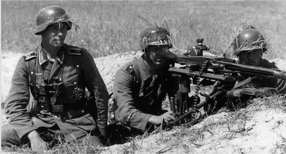
Пулемётчики вермахта «Великая германия»

Государство установило полный контроль над экономикой, регулировало производство продукции, цены, количество нанимаемых работников, уровень зарплаты, продолжительность рабочего дня, вводились общественные работы, изымалась часть прибыли предпринимателей, были запрещены профсоюзы на предприятиях и забастовки.