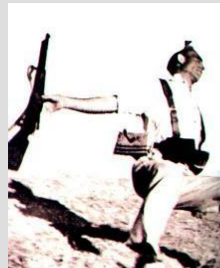
Р.Капа Пал в бою