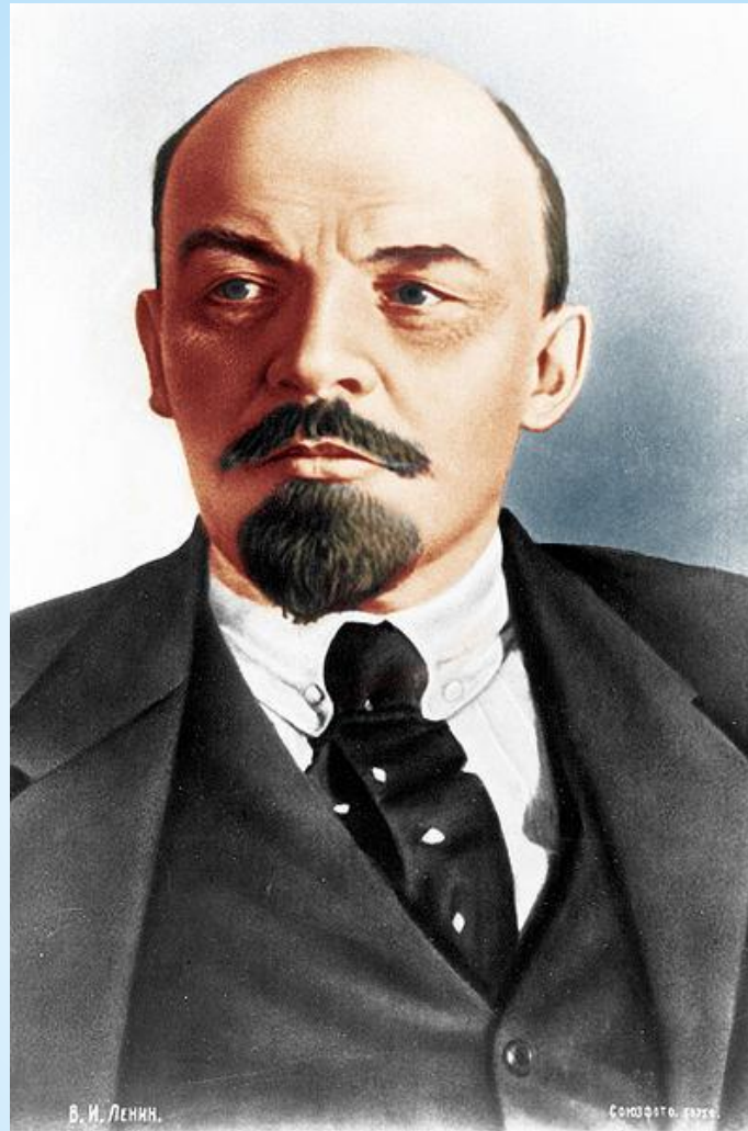
Ленин (Ульянов) Владимир Ильич (1870-1924гг)