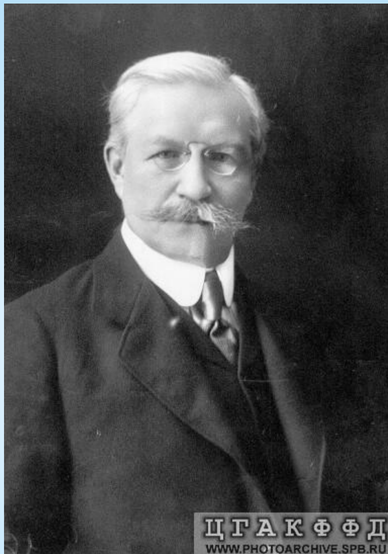
Милюков Павел Николаевич (1859-1943 гг)