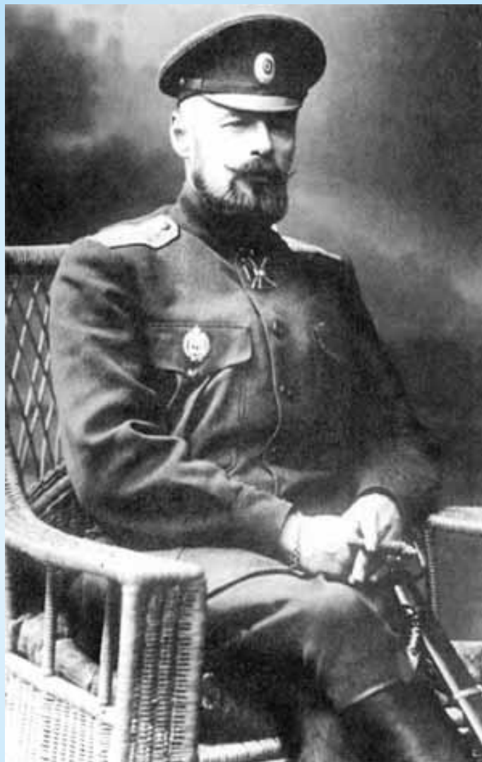
Пуришкевич Владимир Митрофанович (1870-1920гг)