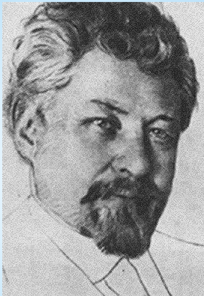
Чернов Виктор Михайлович (1873-1952 гг)