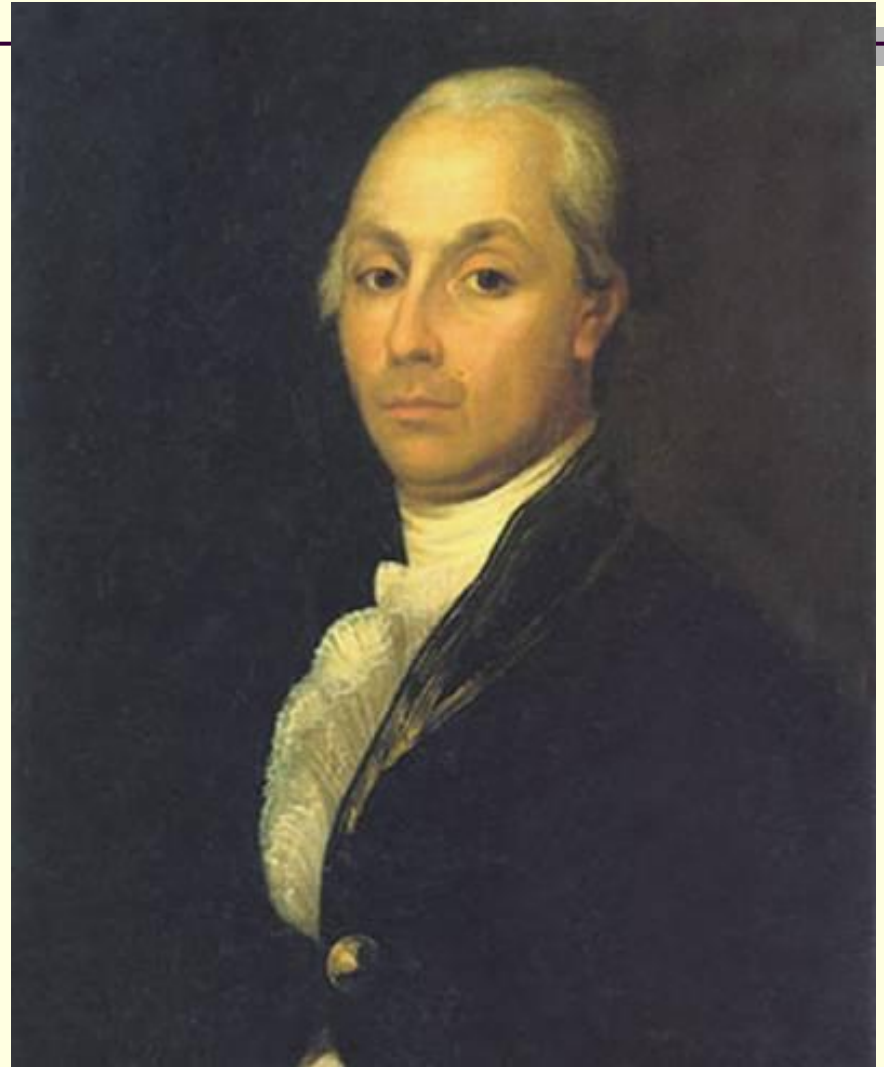
Радищев А. Н.