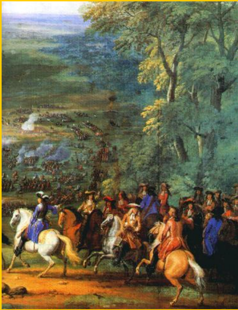
Принц Конде в битве при Рокруа.

Вскоре в Германию вторглись шведы и в 1632 г. Густав Адольф II разбил католиков, но сам погиб. В 1634 г. Валленштейн был убит заговорщиками. Вскоре, в войну вмешалась Франция. Ришелье оказал немецким князьям финансовую помощь. В 1642-46 гг. союзники одержали ряд побед над австрийцами и испанцами, и 24 октября 1648 г. в Мюнстере был подписан Вестфальский мир.