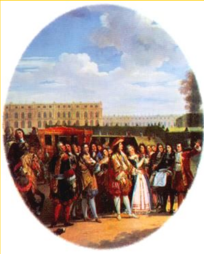
Людовик XIV осматривает Версаль

По окончании войны самыми могущественными государствами стали Швеция и Франция. Французскому королю подражали все европейские монархи. Версаль стал образцом дворцово-паркового зодчества.