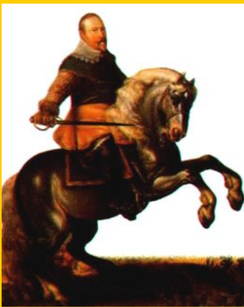
Шведский король Густав Адольф II.

В ответ вспыхнуло восстание. Королем был провозглашен Фридрих Пфальцский- ставленник протестантской лиги. В 1620г. Чехию заняли войска Католической лиги. Протестантов поддержали Швеция, Дания, Франция, Англия, мечтавшие ослабить Габсбургов и присоединить их земли. Во главе католиков встал Альбрехт Валленштейн. Набрал наемников, он разгромил Данию, но был смещен в результате интриг.