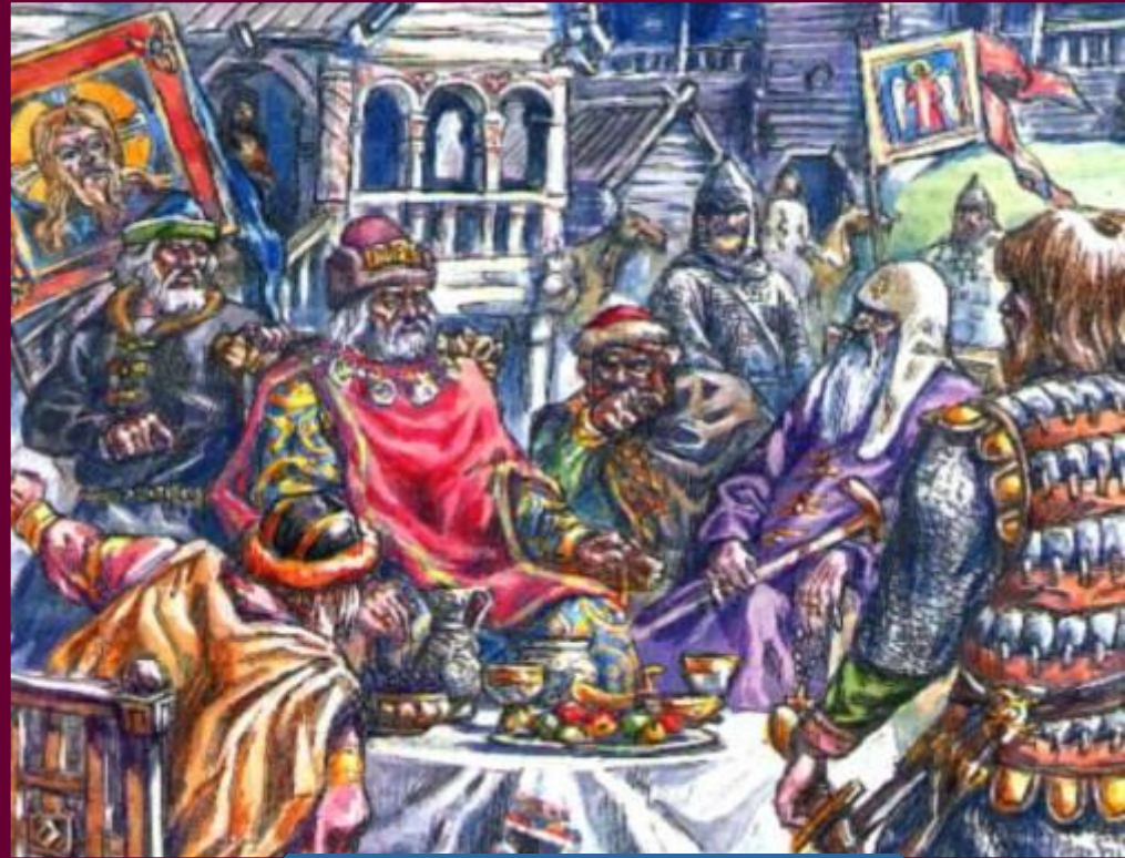
Владимир Мономах на съезде князей.

По словам летописца «Раздрася вся Земля Русская