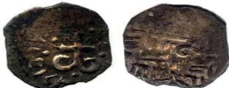
Монета Александра Наримонтовича, Стародуб, 1367-1370 гг. Серебро, диаметр 16 мм, вес 1.45 гр.