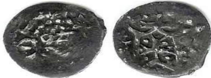
Монета Владимира Ольгердовича, Киев, 1363-1377 гг. Серебро, диаметр 14 мм, вес 0.50 гр.