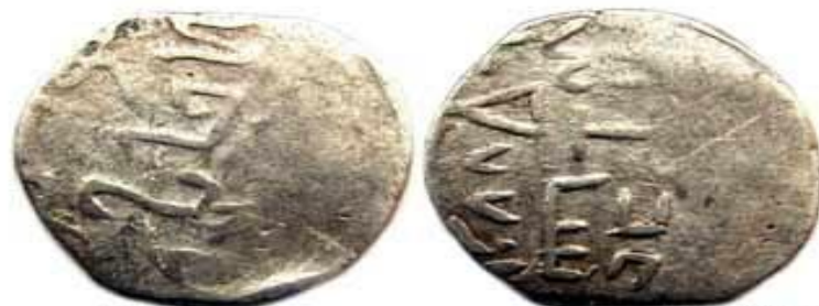
Монета Дмитрия Ольгердовича, Брянск, 1373-1376 гг. Серебро, диаметр 16 мм, вес 1.10 гр.