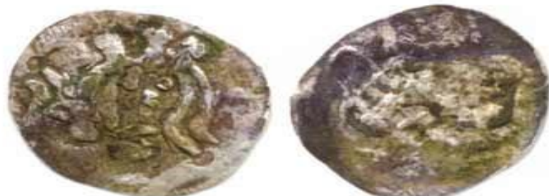
Монета Ягайло Ольгердовича, Вильно, 1387-1388 гг. Серебро, диаметр 14 мм, вес 0.60 гр.