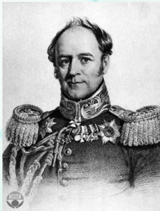
Александр Христофорович Бенкендорф