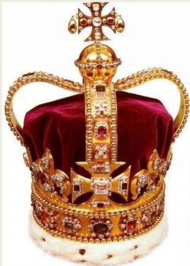
Корона Святого Вацлава (Корона чешских королей