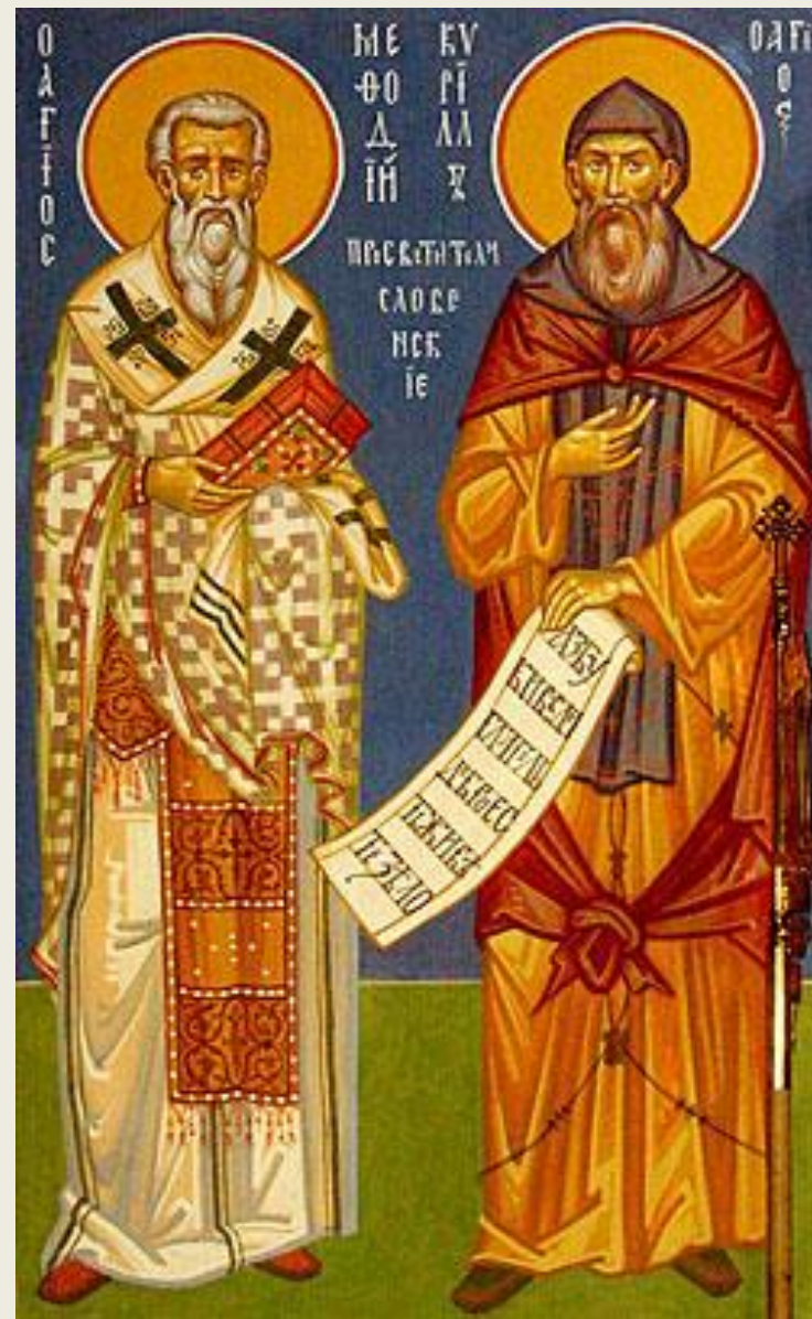
Святые равноапостольные братья Кирилл и Мефодий.