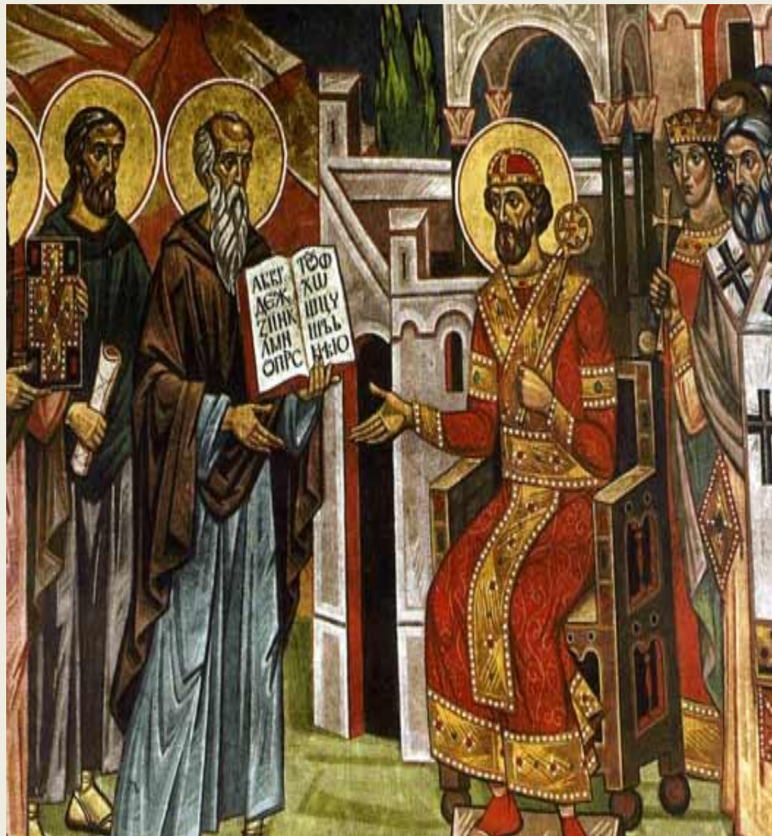
Болгарский царь Борис

К XI веку , ослабев от непрерывных войн, Болгария попадает под власть Византии.