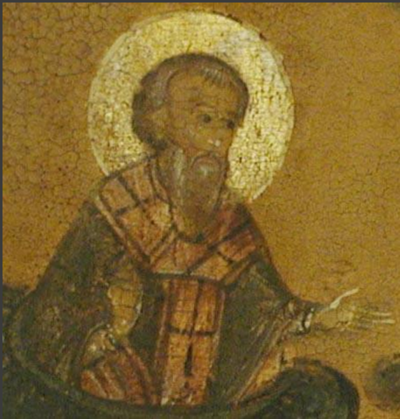
Слово о законе и благодати (митрополит Иларион)