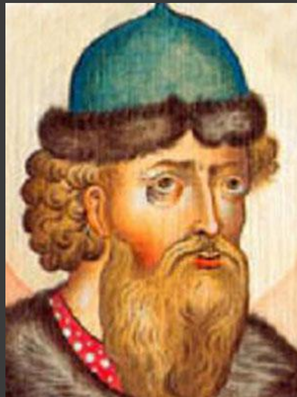
Поучение Владимира Мономаха