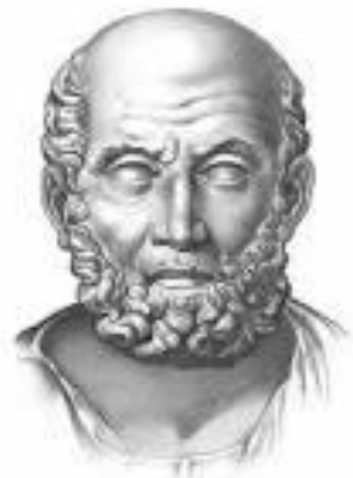
ГИППОКРАТ 460-370 до н. э.

Греческий врач Гиппократ стал основателем классической медицины, живший на рубеже V—IV вв. до н. э. Его образование началось в школе жрецов: он изучал вавилонские и египетские тексты, а для углубления полученных знаний предпринял путешествие в Египет, на Сицилию и в Ливию. Достаточно рано он ушел от жреческо-религиозной традиции к созданию медицинской науки, характеризующейся научным и рациональным подходом к действительности. Гиппократ доказал, что причиной болезней вовсе не являются злые духи, что болезни возникают вследствие плохой работы