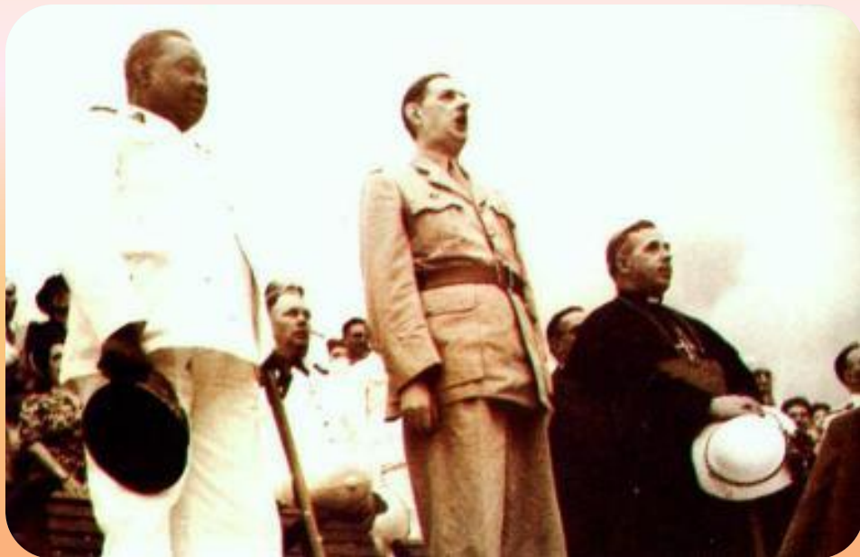
Генерал де Голль

В 1958 г. де Голль стал премьером и провел через референдум Конституцию, превращавшую Францию в президентскую республику. Последующий период вошёл в историю Франции под названием Пятой республики. В 1960г. Шарль де Голль предоставил независимость всем колониям, кроме Алжира, который стал независимым в 1962 г. Правые дважды пытались организовать на него покушения, но потерпели неудачу. В 1966 г. Франция вышла из военной организации НАТО. На фоне уменьшения зависимости Франции от США улучшались её отношения с СССР.