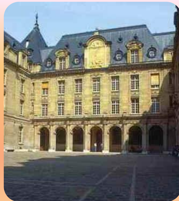
Сорбонский университет. Париж.

Но постепенно в стране начало нарастать недовольство авторитарным стилем руководства, характерным для Ш. Де Голля.