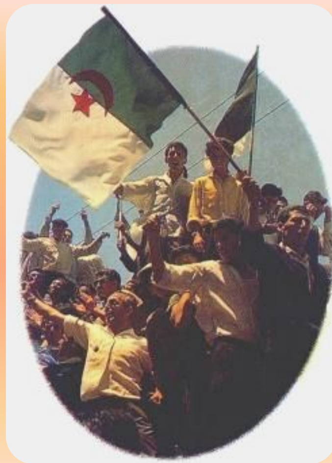
Провозглашение независимости Алжира