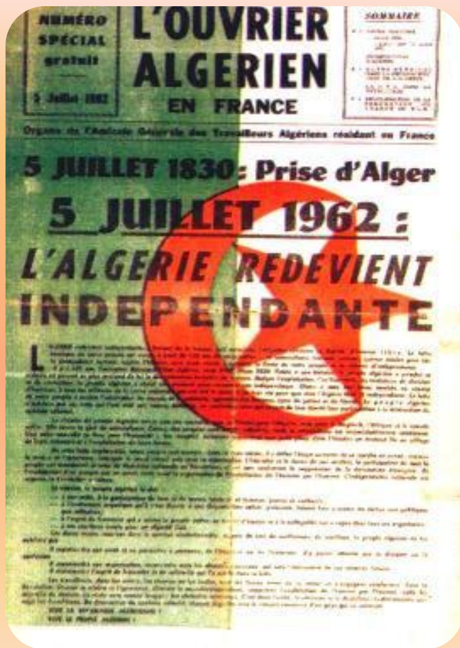
Договор о независимости Алжира