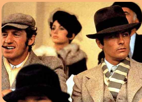
А.Делон и Ж.-П. Бельмондо

Афиша фильма Жан Люка Годара "Презрение" (1963 г.), в котором Брижит Бардо сыграла главную роль