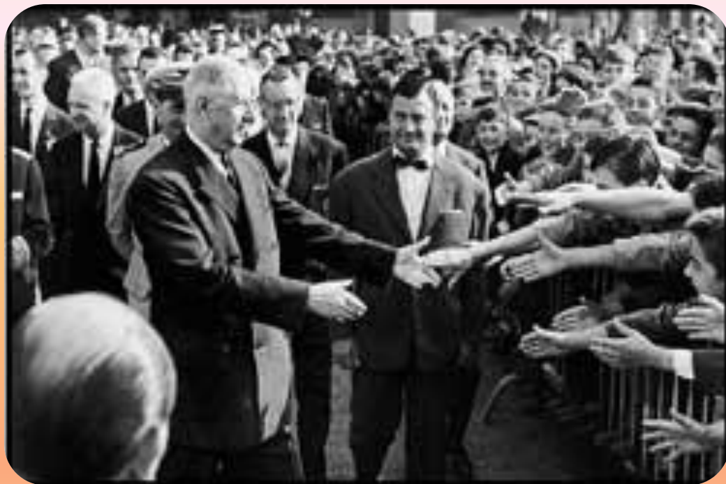
Французы приветствуют Шарля де Голля

В послевоенной Франции расстановку политических сил определяли Французская Коммунистическая партия (ФКП), Социалистическая партия (СФИО), Католическая партия и Народно-республиканское движение (МРП). В октябре 1945 г. состоялись выборы в Учредительное собрание, победу на которых одержали левые силы, активно участвовавшие в Движении Сопротивления. Во главе сформировавшегося правительства стал Шарль де Голль. В 1946 г. была принята новая Конституция, которая знаменовала собой установление во Франции Четвёртой республики.