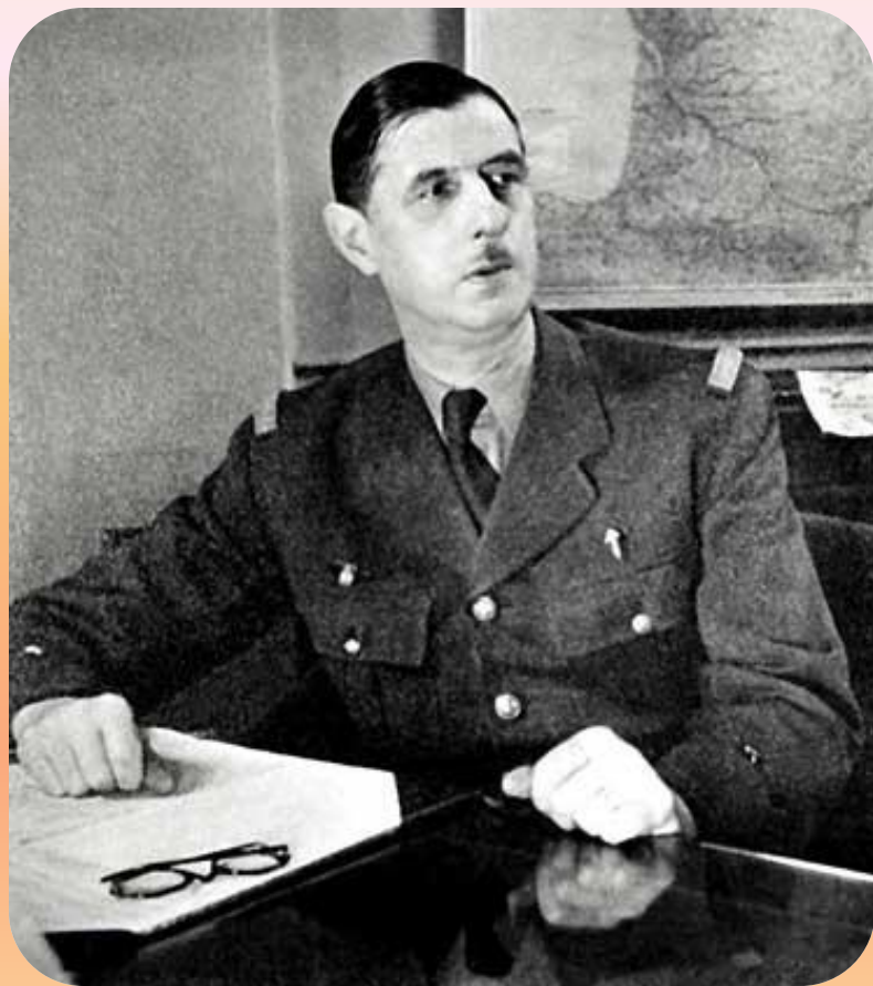
Шарль де Голль

После окончания Второй мировой войны Франция утратила положение великой державы. На фоне экономического упадка страна попала в зависимость от финансовой политики США. После войны распалась и французская колониальная система. Летом 1944 г. во Франции было образовано Временное правительство, которое возглавил Шарль де Голль. Оно начало подготовку к выборам Учредительного собрания. В стране был восстановлен демократический строй. К суду были привлечены люди, сотрудничавшие с гитлеровцами. В экономике страны были национализированы ряд отраслей промышленности.