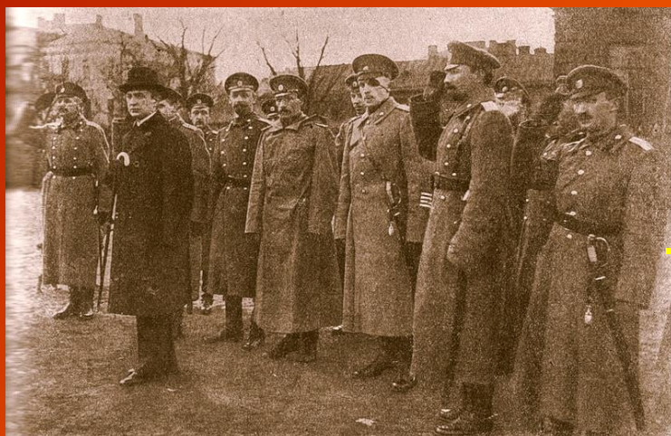
А. Ф. Керенский.