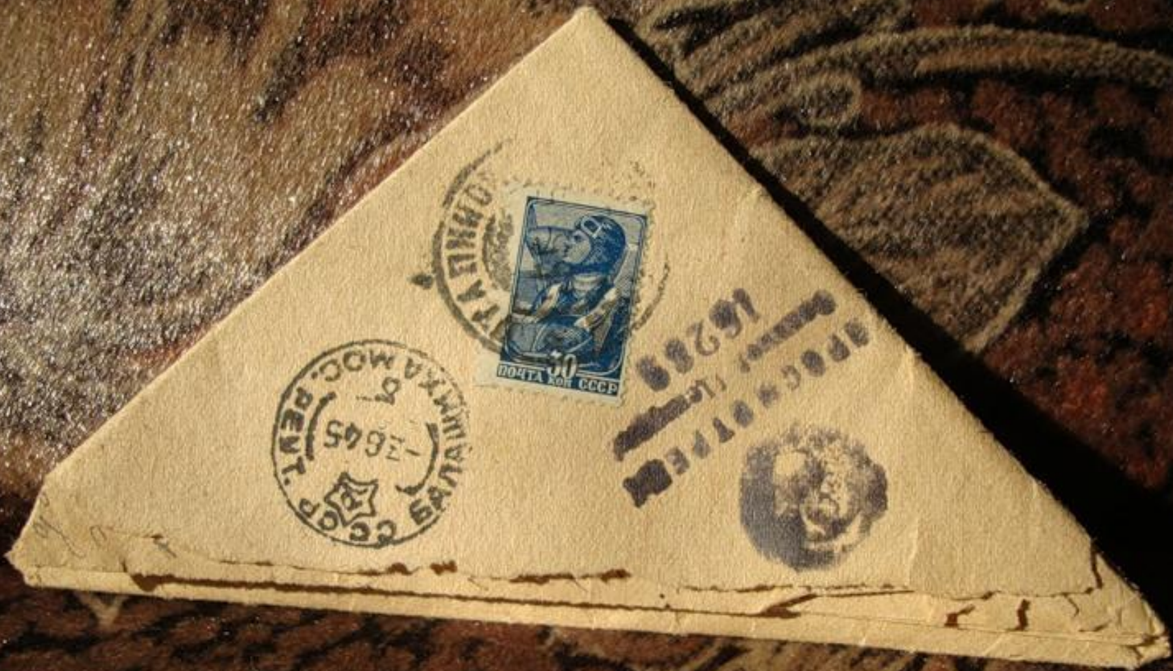
Письма военных лет