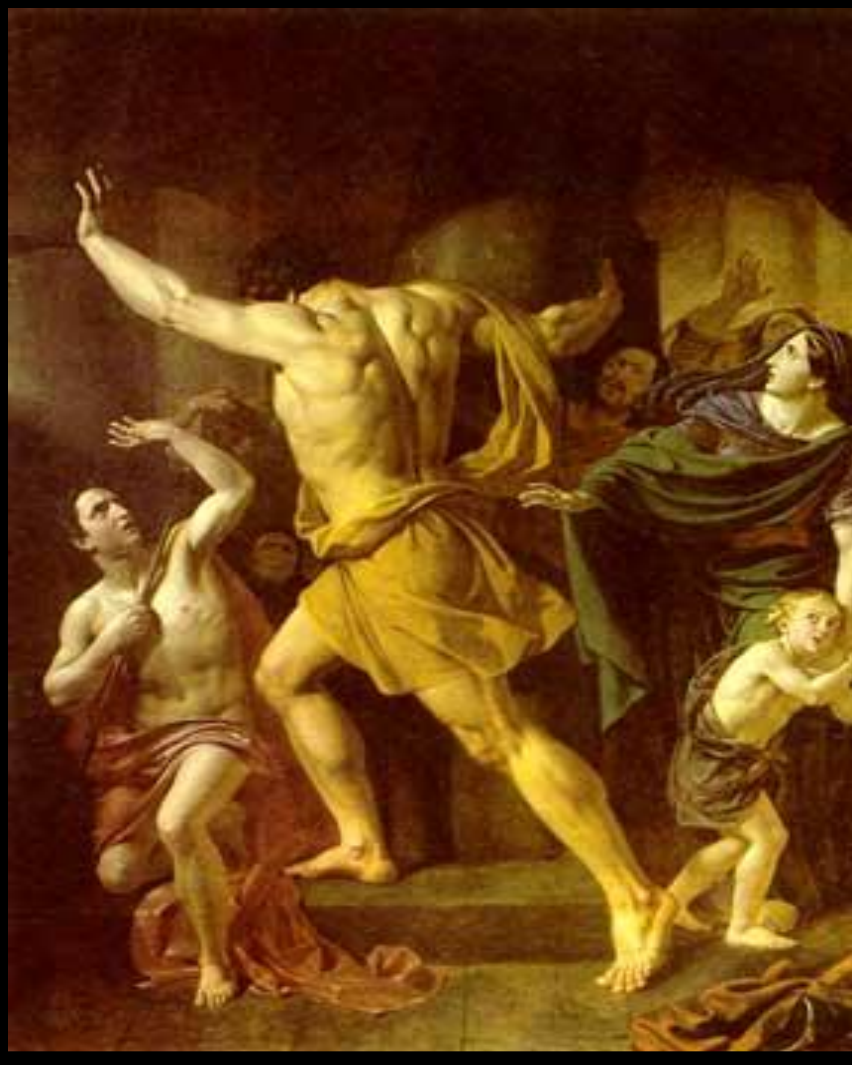
Самсон разрушает храм филистимлян.

Один из евреев Самсон-обладал огромной силой. Он полюбил красавицу Далилу и та узнала, что его сила кроется в волосах. Спящего Самсона остригли и связали. Он был ослеплен и брошен в темницу. Филистимляне устроили пир и стали издеваться над Самсоном. Но его волосы уже отрасли. Самсон схватился за колонны и обрушил здание.