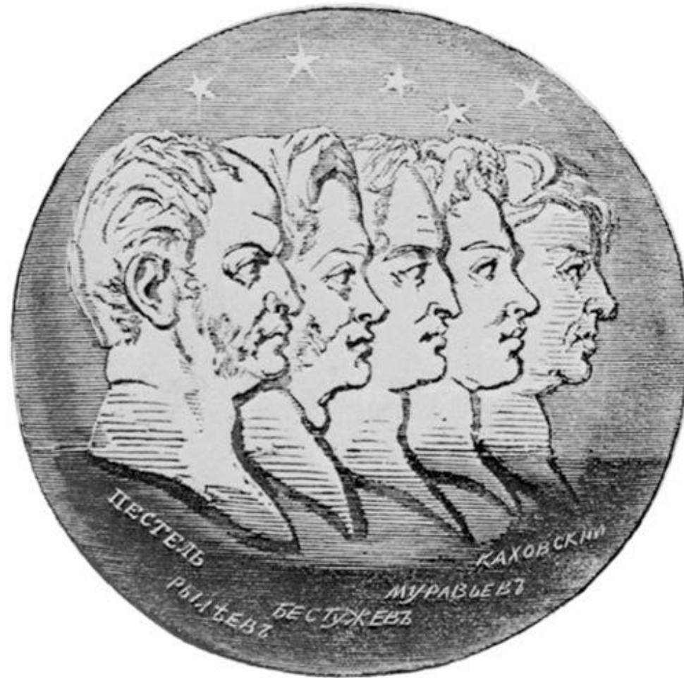
Силуэты пяти казнённых декабристов. Медальон с титульного листа альманаха «Полярная звезда»