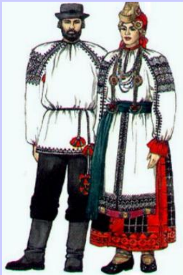
Русский национальный костюм.

За 100 лет численность населения выросла с 15,5 млн. до 43,7 млн. человек. Плотность населения была крайне неравномерной - за Уралом проживало всего 3 млн. человек. На окраинах Европейской части плотность населения не превышала 1 человека на 1 кв. км.