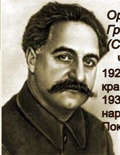
Орджоникидзе Григорий Константинович (Серго)

Член РСДРП с 1903г. 1922-1926- 1-й секретарь Закавказского крайкома РКП (б). 1932г.- Председатель ВСНХ, нарком тяжелой промышленности. Покончил жизнь самоубийством.