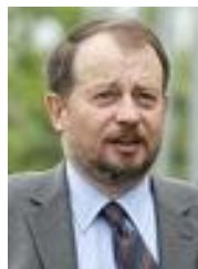
В.Лисин НЛМК $ 24млн.