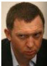
Олег Дерипаска Базовый элемент $ 18,6 млн.