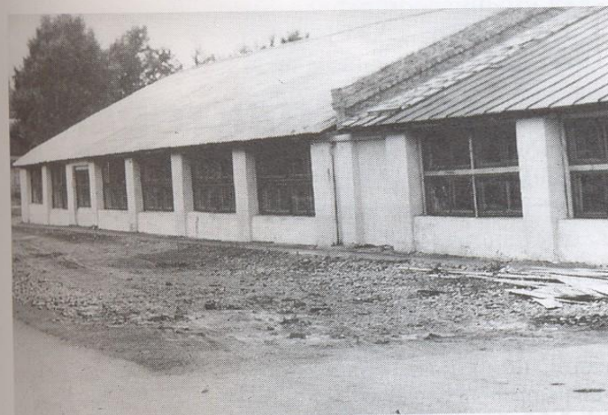
Мастерская № 130.