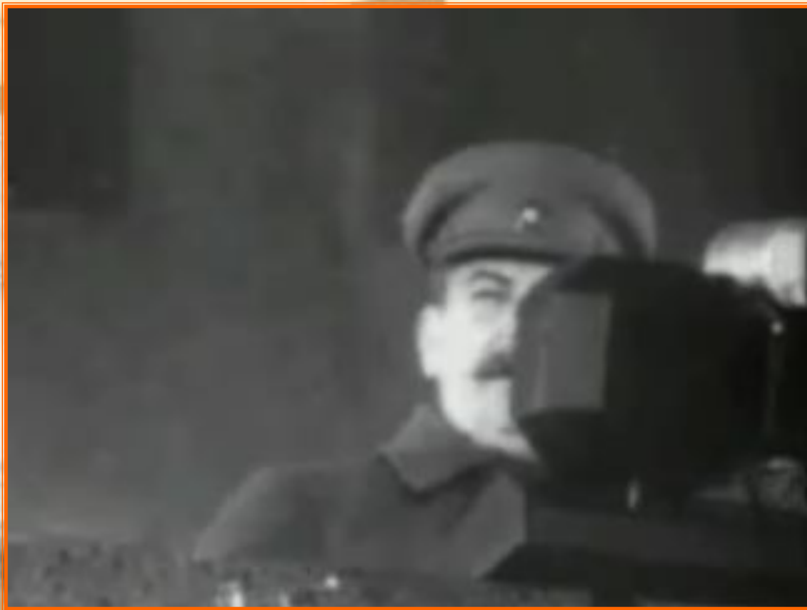
Речь И.В. Сталина на параде 7 ноября 1941 г.