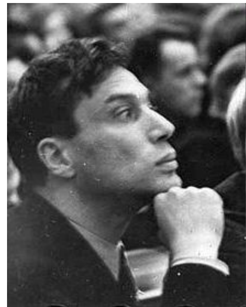
Борис Леонидович Пастернак

не был ни расстрелян, ни посажен в тюрьму