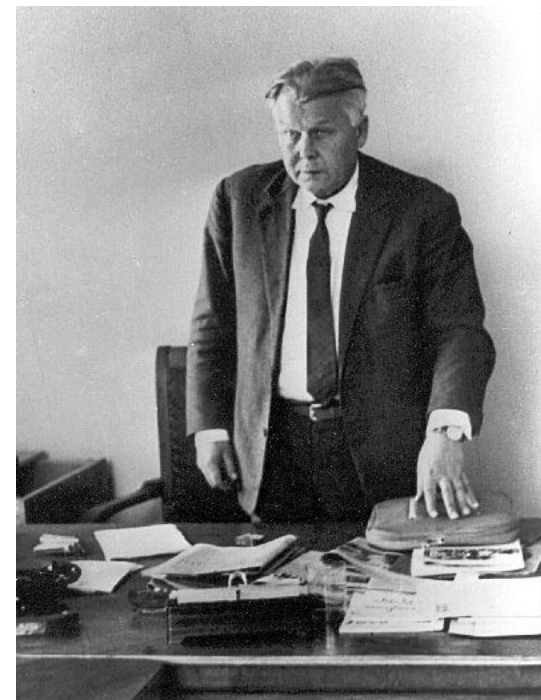
Александр Трифонович Твардовский

Власть признала публикацию этих работ «вредной» и отстранила А. Твардовского от руководства журналом