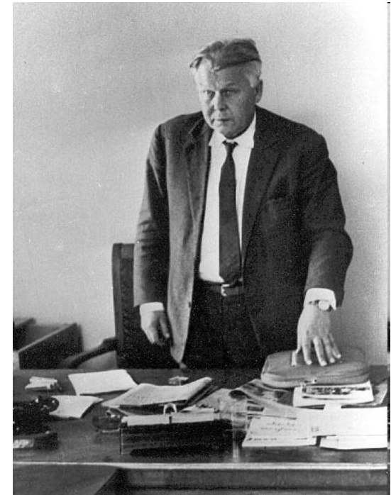
Александр Трифонович Твардовский

Власть признала публикацию этих работ «вредной» и отстранила А. Твардовского от руководства журналом