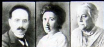
К. Либкнехт Р. Люксембург К. Цеткин

Интернационалисты, активно борющиеся против империалистической войны