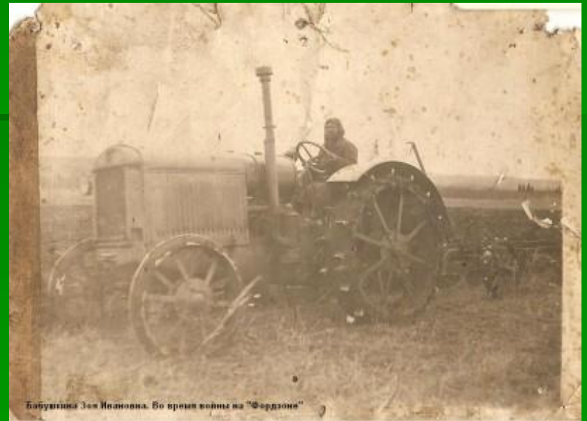
Бабушка Эм Ивановна. Во время войны на "Фордзоне"