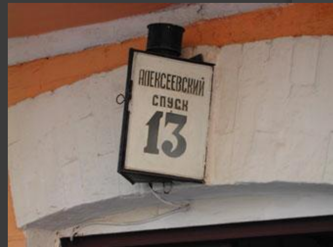
Этот номер - самый важный номер на Андреевском спуске!