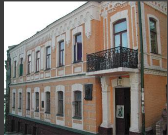
А вот и сам дом-музей М. А. Булгакова. Этот дом занимала с 1906 по 1919 гг. семья Булгаковых. Здесь же жили и Турбины.

После выздоровления Булгаков оставил медицину и начал сотрудничать с газетами. «Грядущие перспективы» – так называется одна из его первых публицистических статей. Первые драматургические опыты появились во Владикавказе: одноактная юмореска «Самооборона», «Парижские коммунары», драма «Братья Турбины» и «Сыновья муллы».