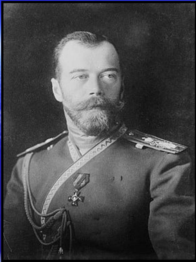
Император Николай II