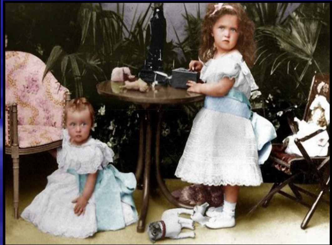
Ольга и Анастасия Романовы...