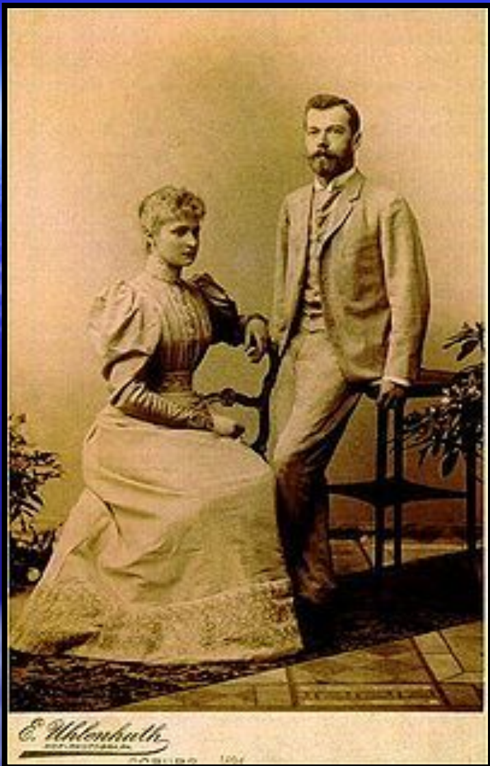
Цесаревич Николай Александрович и принцесса Алиса Гессенская после помолвки (Кобург, апрель 1894 года)