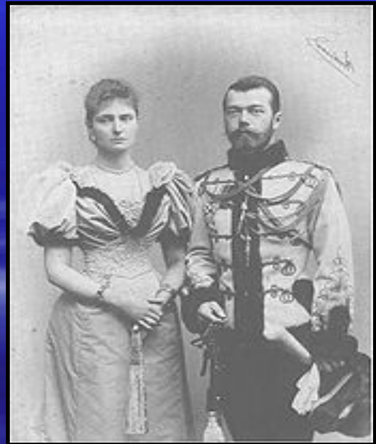
...с женой Александрой Фёдоровной