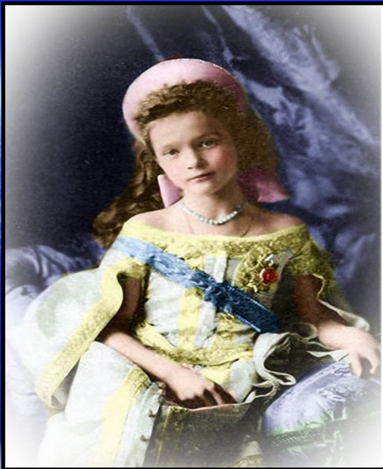
Великая княжна Татьяна Николаевна...