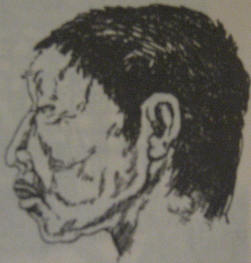
Шилкинский человек. Реконструкция Н.Н. Мамоновой