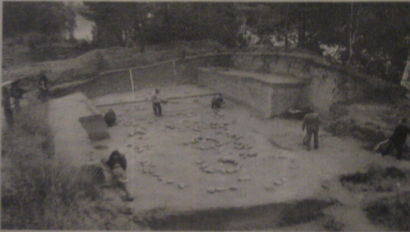
Раскопки древнего поселения Студенное на реке Чикой

астительность? К какому виду принадлежат выявленные кости животных? ругие вопросы могут ответить геологи, палеоботаники, палеозоологи и другие