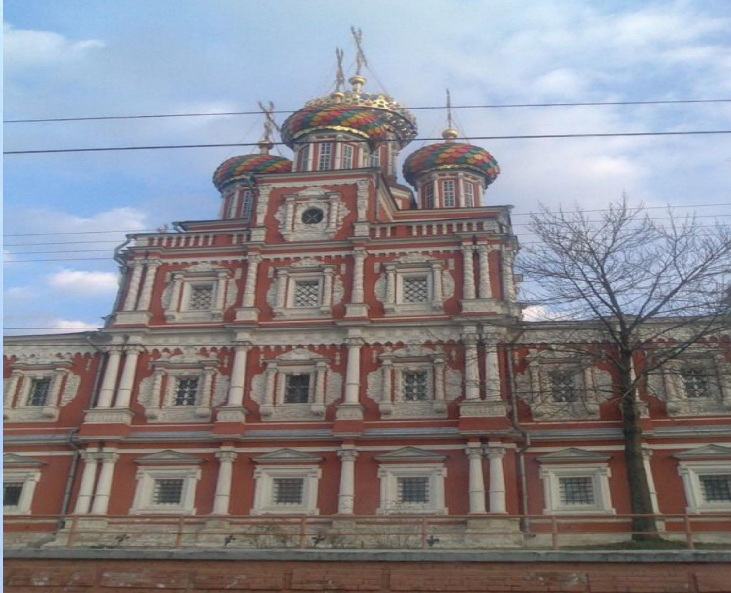
Рождественская церковь при усадьбе Строгановых