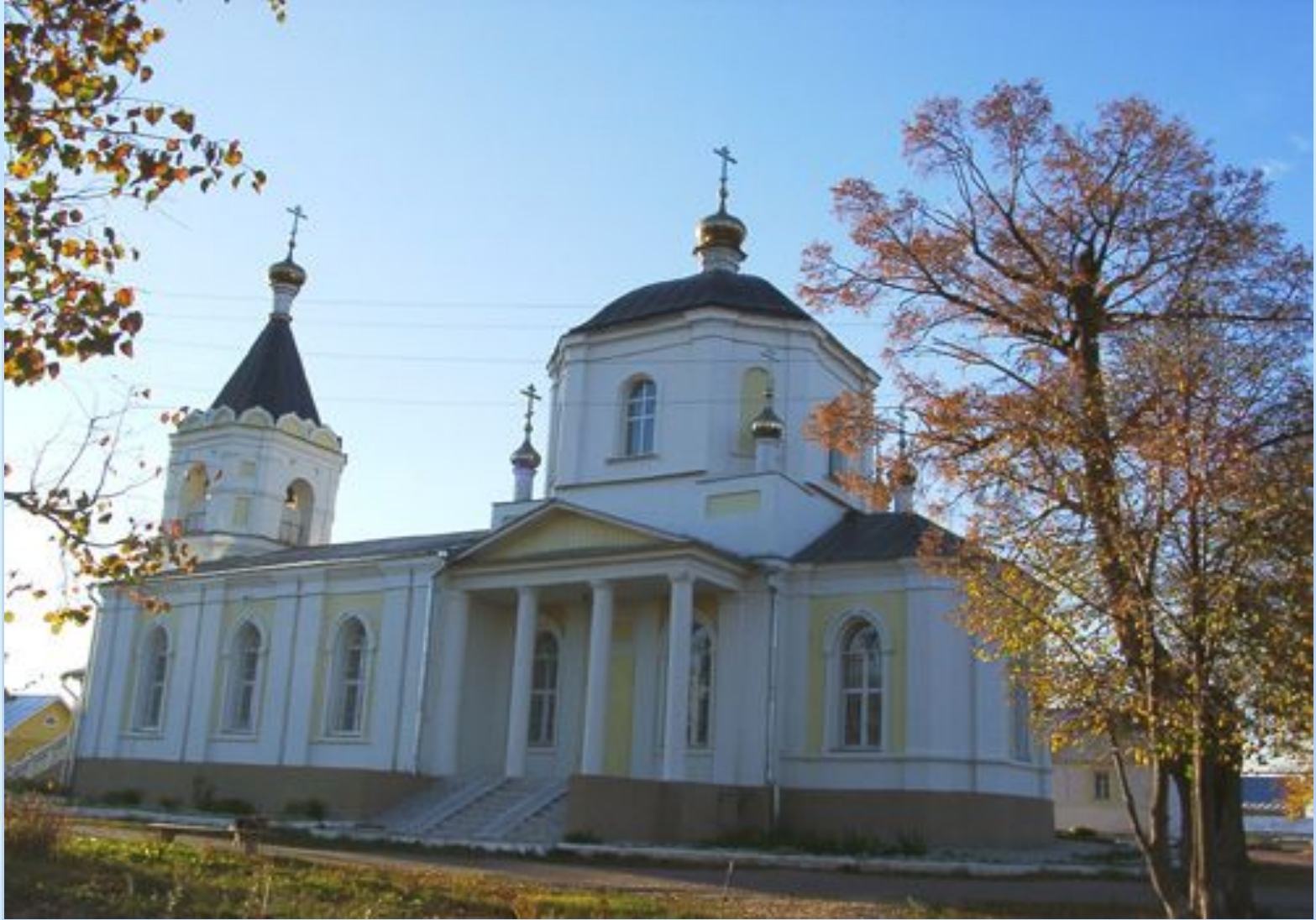
Усадьба Улыбышевых в Лукине