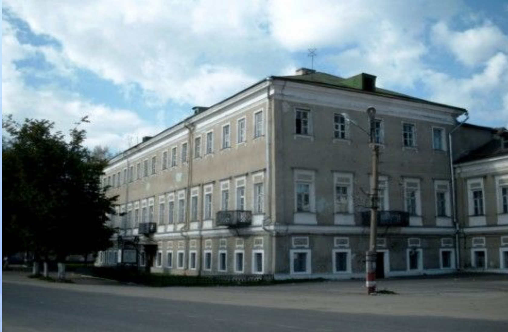
Усадьба И.Р. Баташева в Выксе