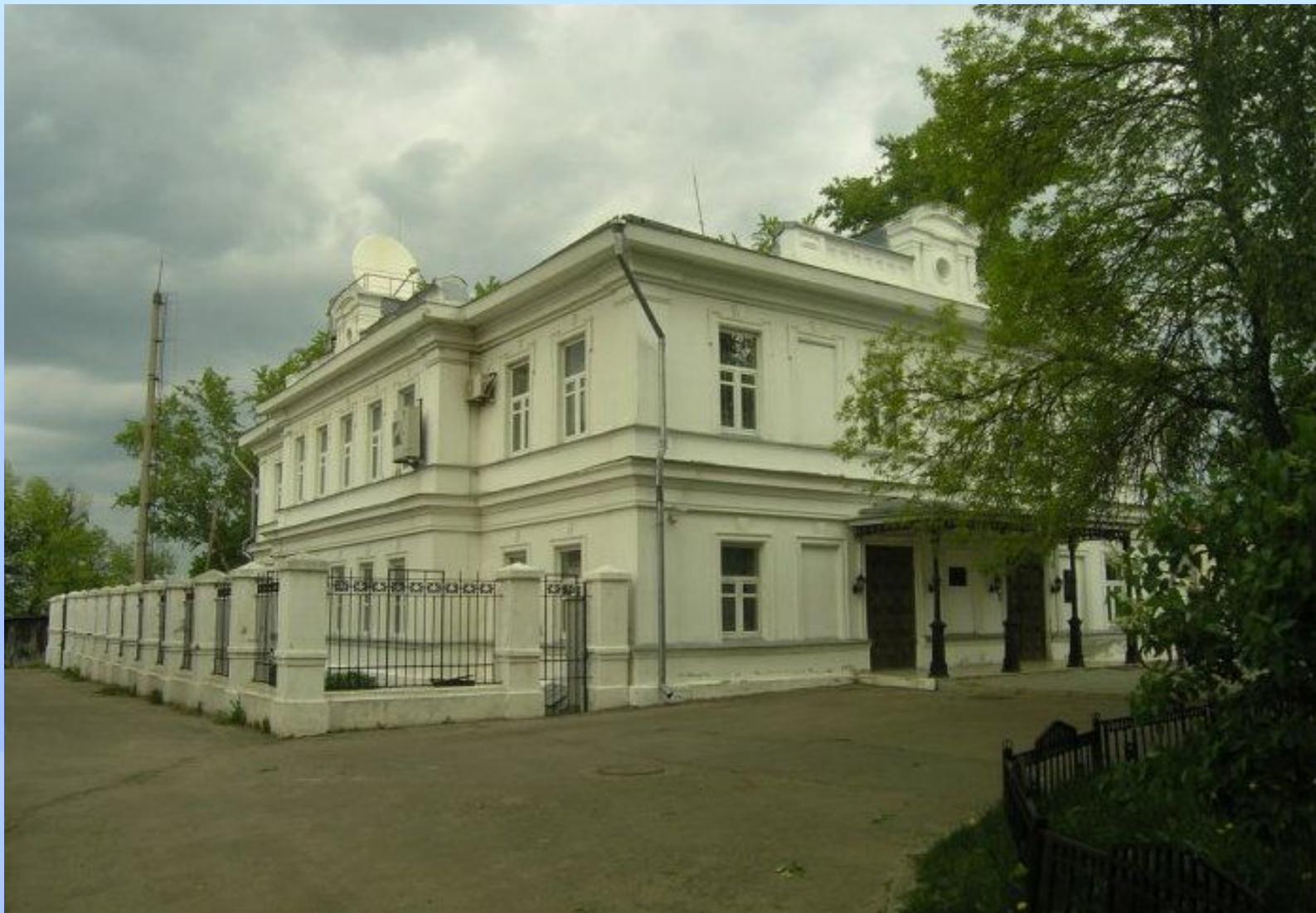
Усадьба Г.А. Грузинского в Лыскове