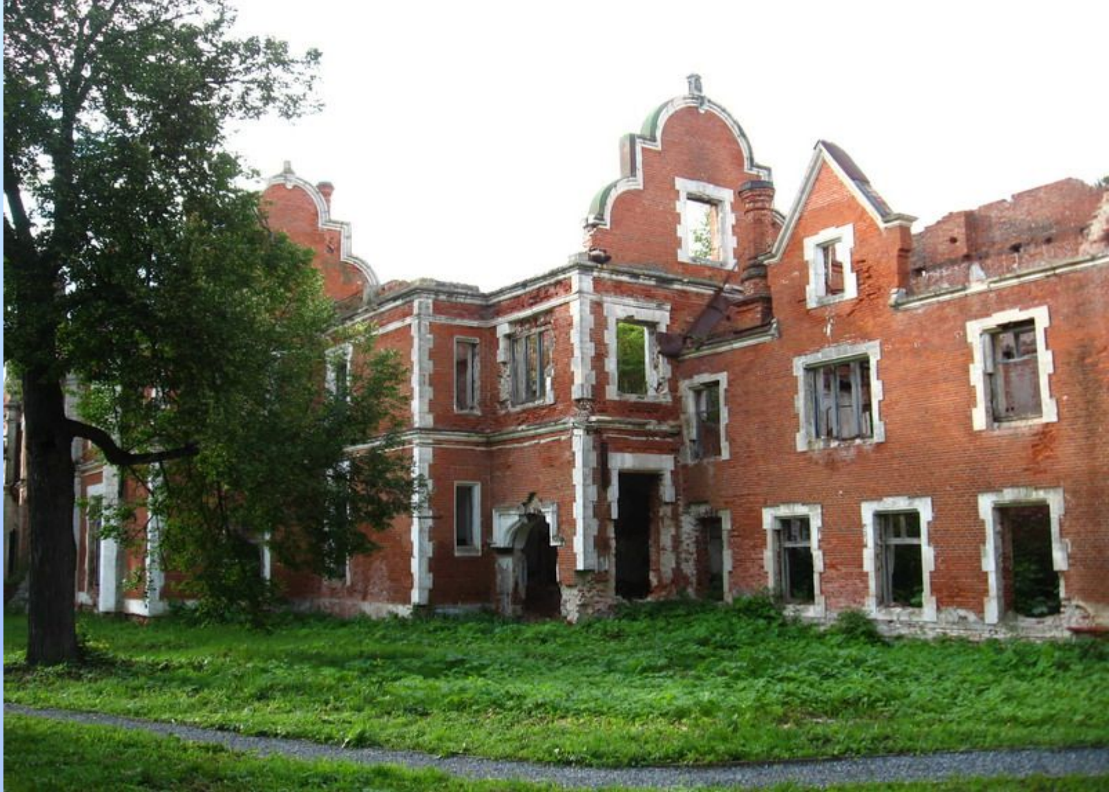
Усадьба Пашковых в Ветошкине