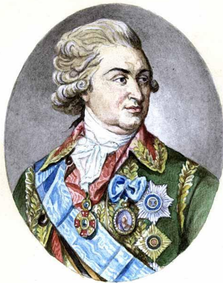
А. Г. Потёмкин

Фавориты – лица, пользующие благосклонностью правителя.