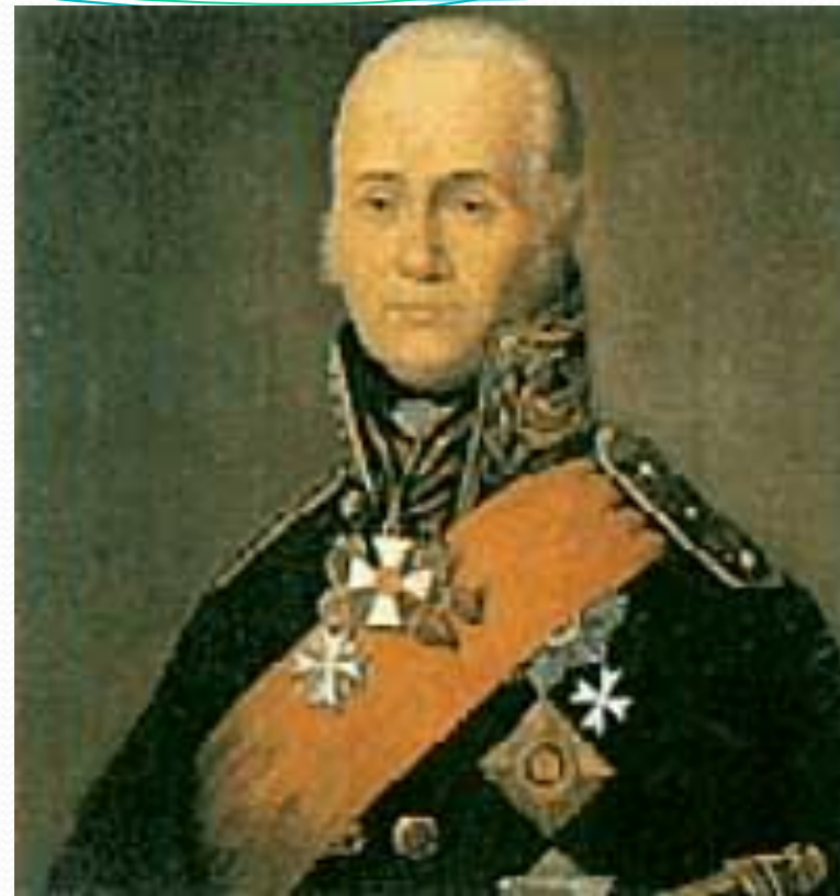
Г.А. Спиридов и Ф.Ф. Ушаков