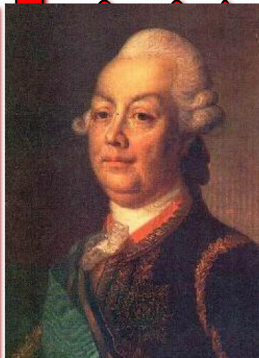
А.В. Суворов и П.А. Румянцев