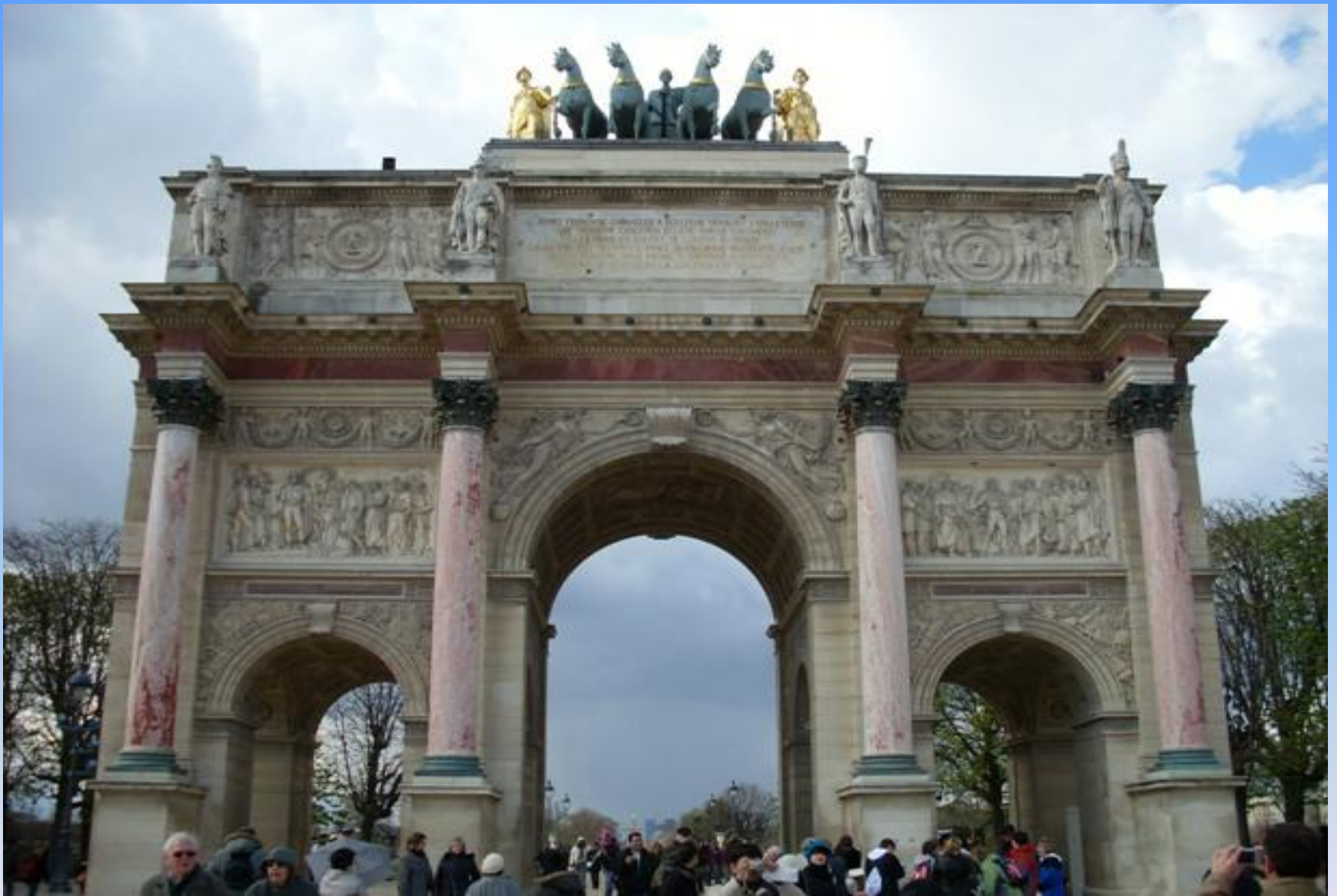
Арка Карусель (1806-1808 гг) архитекторы Фонтен и Персье)