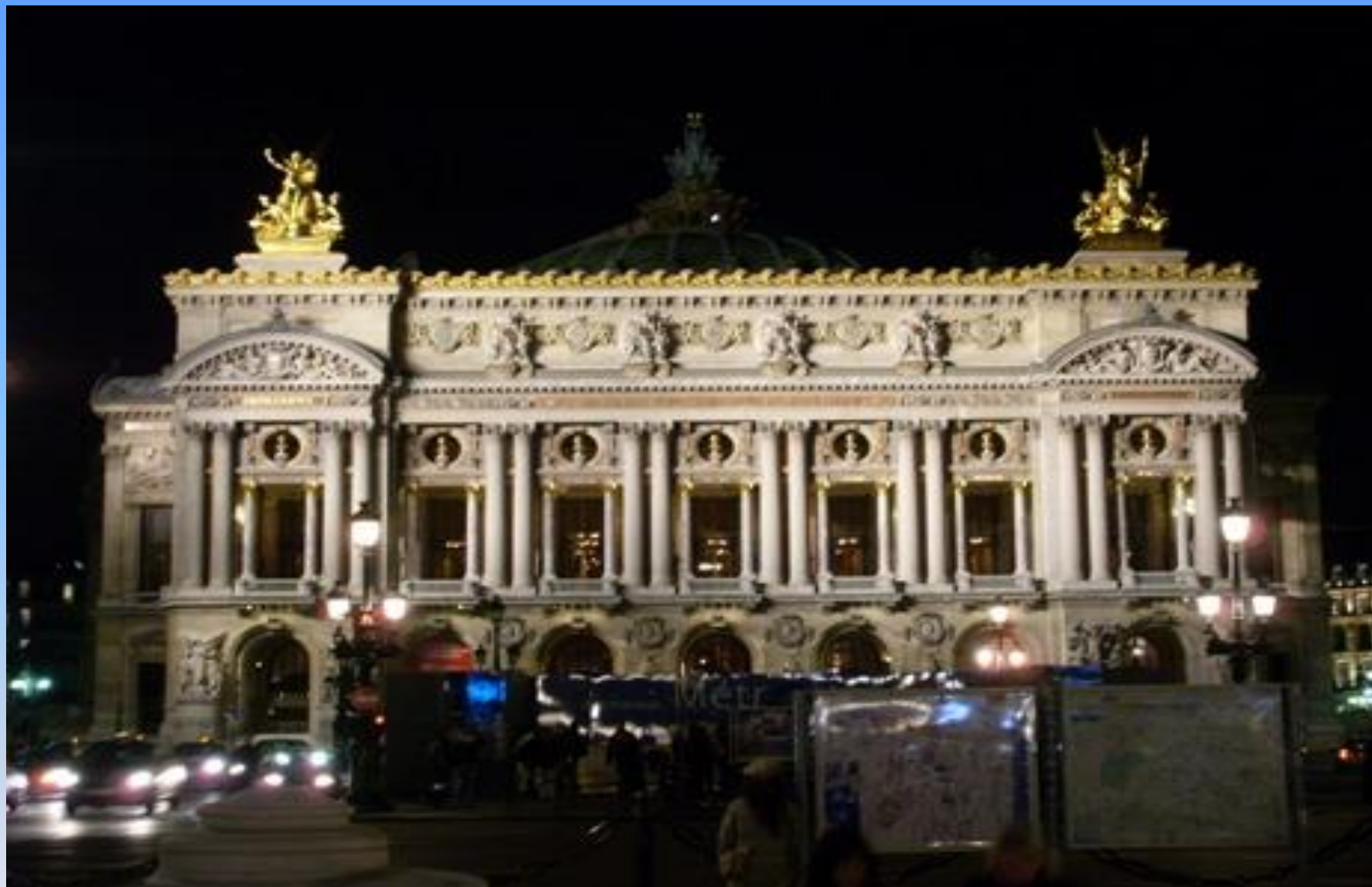
Гранд- Опера (опера Гарнье), арх. Ш. Гарнье, 1875 г.