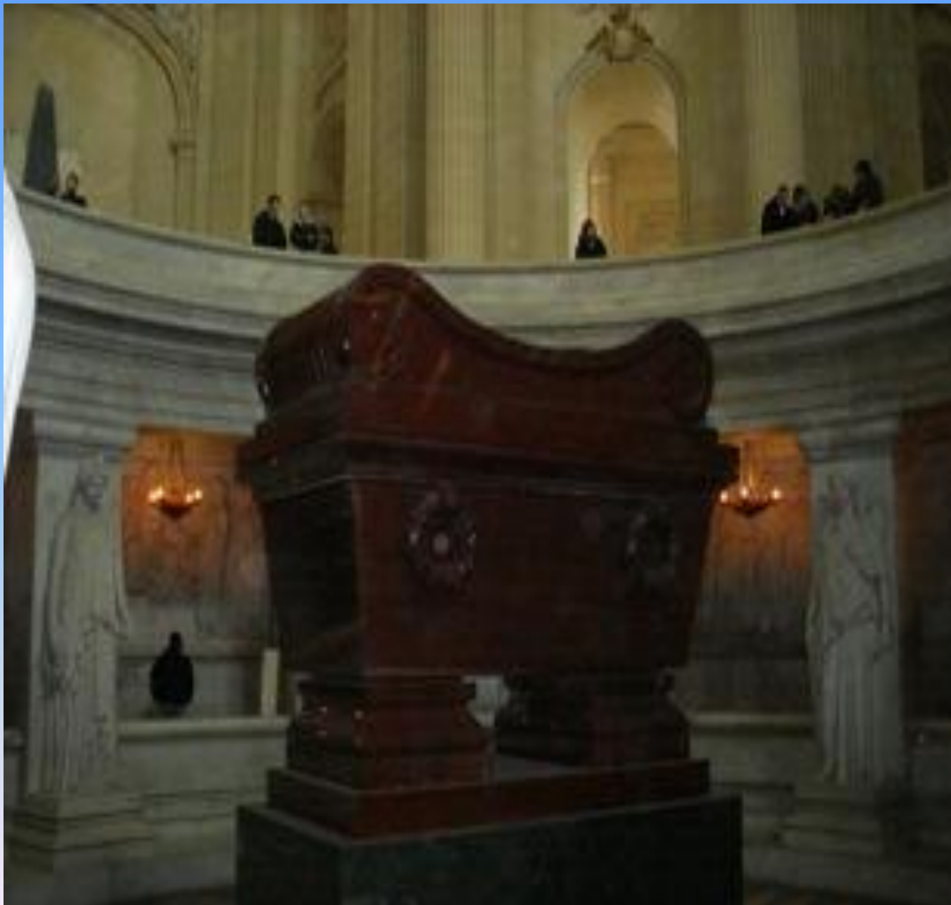
Гробница Наполеона в Соборе Дома Инвалидов.