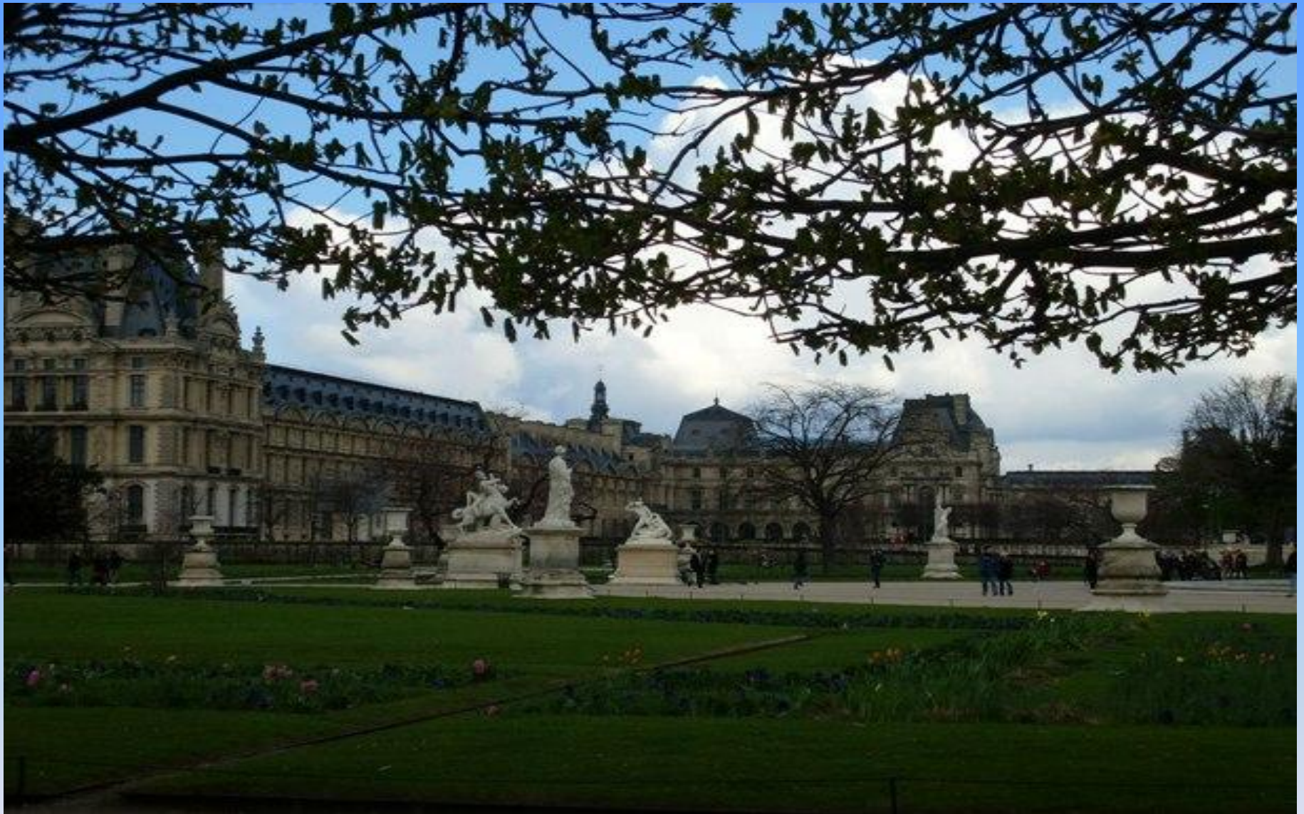
Сад Тюильри ( XVII век- архитектор Ленотр) на фоне Лувра