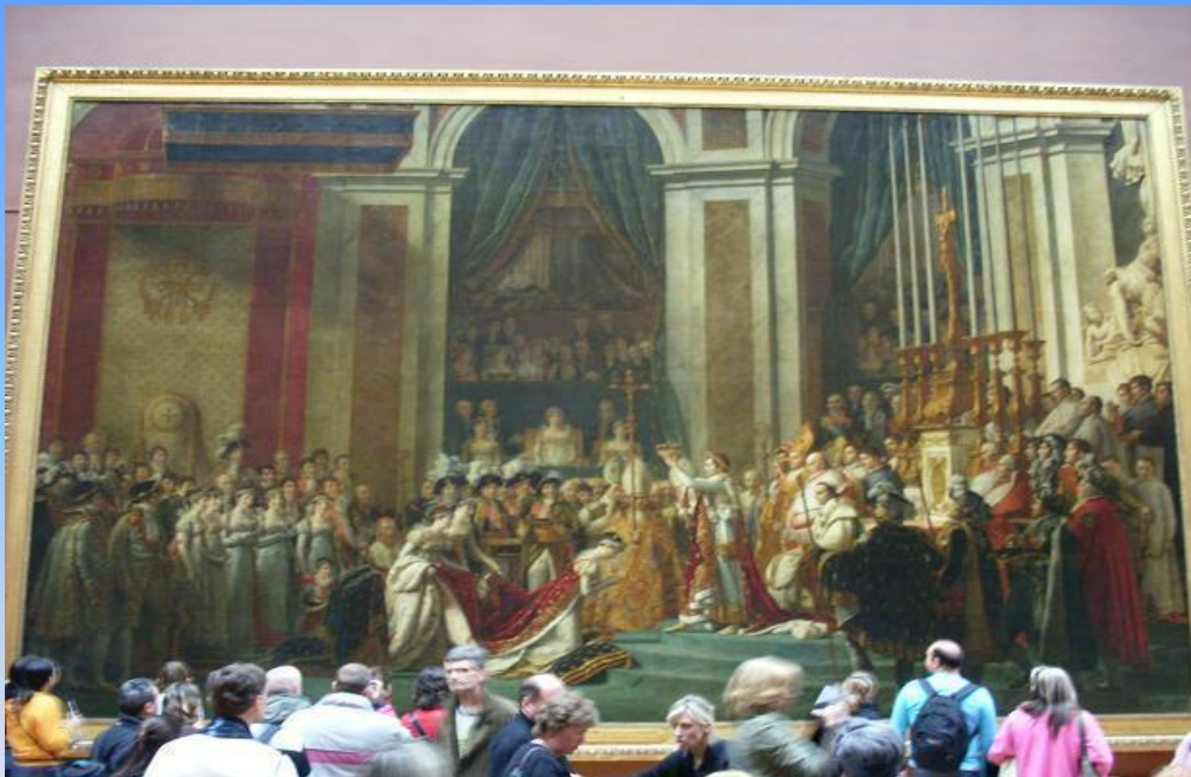
Жак Луи Давид «Коронация Наполеона»