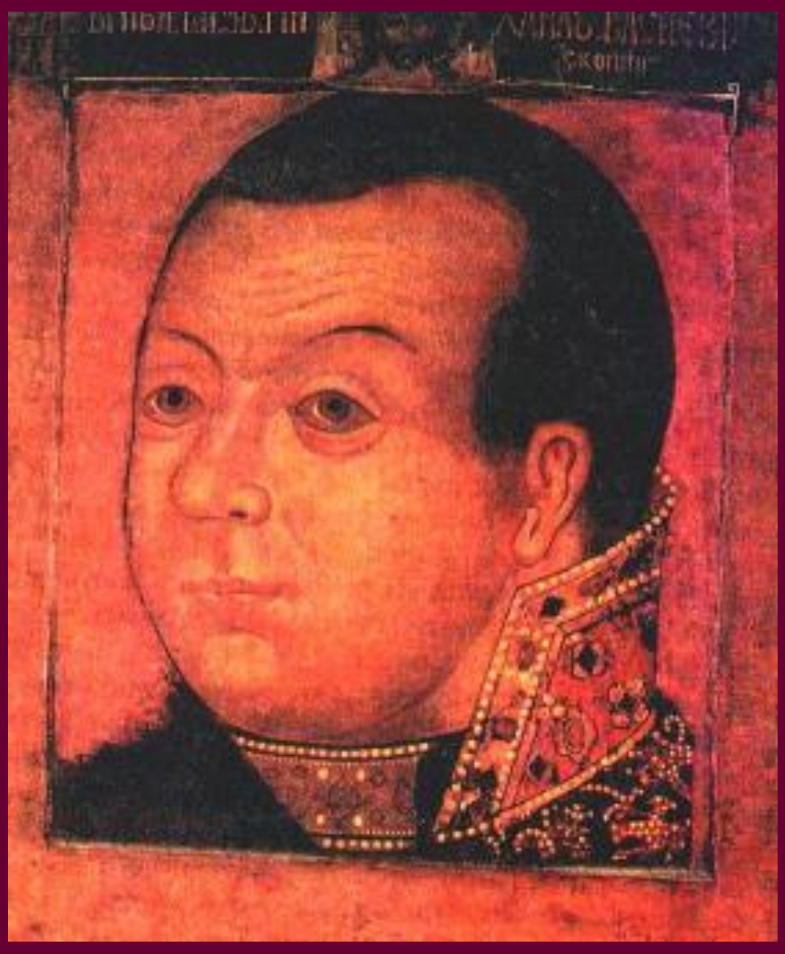
Портрет М.В. Скопин-Шуйский

В н. 17 века впервые в русской живописи появляется жанр портрета.