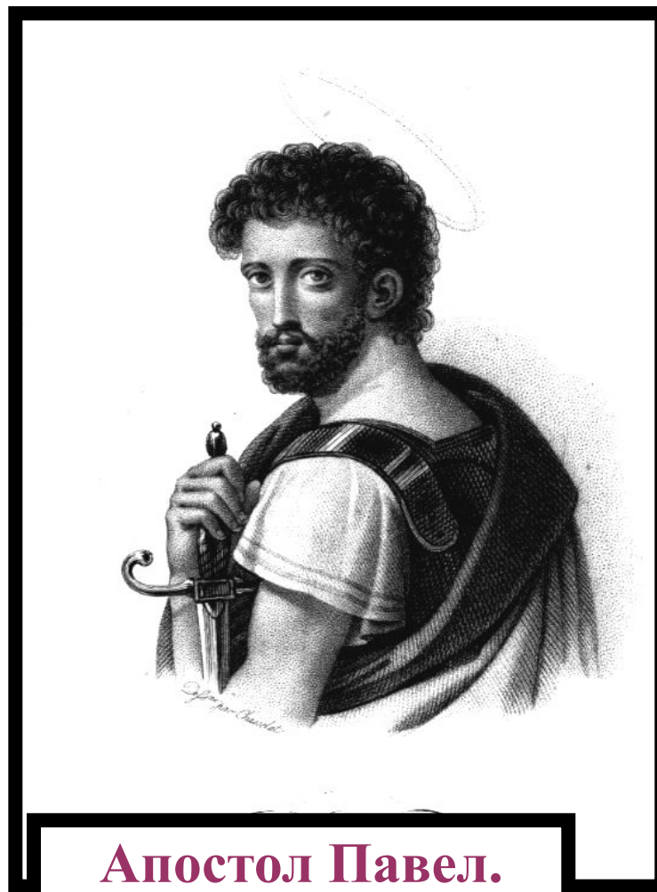
Апостол Павел. Гравюра 18 века.