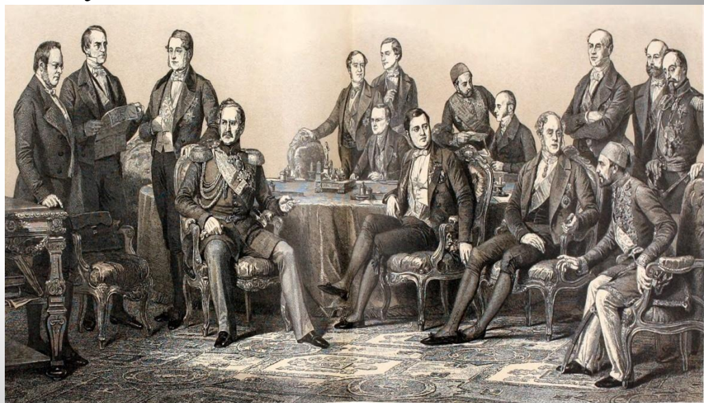
Cavour Cowley Buol Orlov Bourqueney Hilmar Walewski Djemil Benedetti Clarendon Brunner Aali Haridjeh Villamarina