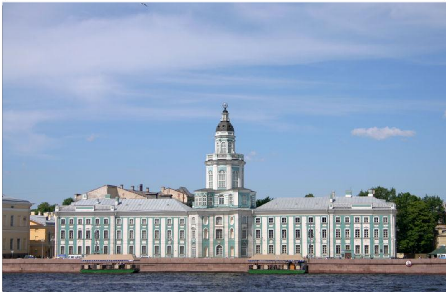
Место работы – Академия наук