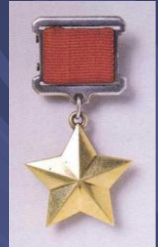
Сафонов Борис Феоктистович 26. 8. 1915 - 30. 5. 1942 Дважды Герой Советского Союза