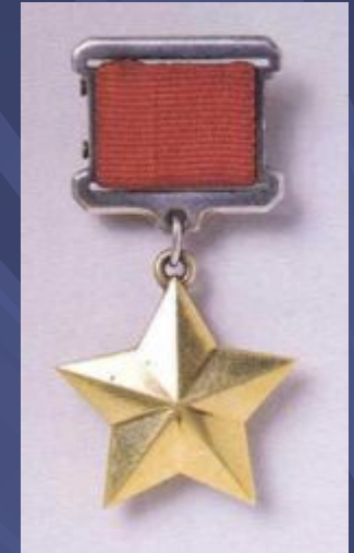
Сафонов Борис Феокистович 26. 8. 1915 - 30. 5. 1942 Дважды Герой Советского Союза