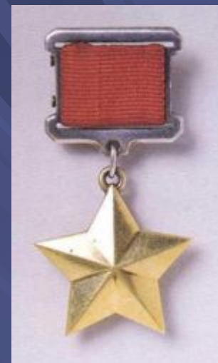
Шабалин Александр Осипович 4. 11. 1914 - 16. 1. 1982 Дважды Герой Советского Союза